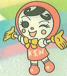
人権イメージキャラクター 人KEN あゆみちゃん