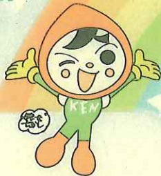
人権イメージキャラクター 人KEN まもる君