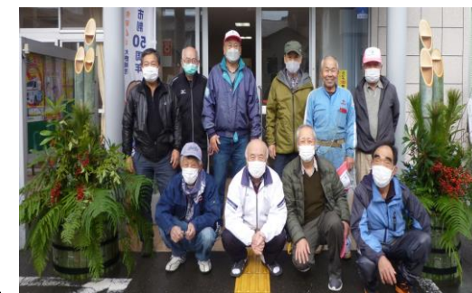
門松完成しました☆ いい年になりますように…