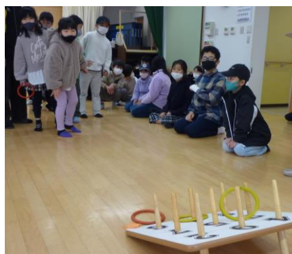
しっかりねらってね