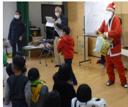
区長サンタからプレゼント