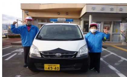
地域の安全守ります