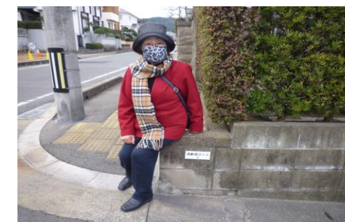
・ほっとひと息・