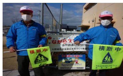
しっかり見守り続けます