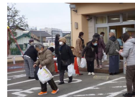
たくさんのつながりを大切に

コロナが終息して、平野ふれあい食堂ができるだけ早くオープンできることを心待ちにしています。