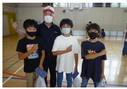
小学生の部でもダブル優勝