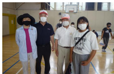
年齢フリーの部で見事優勝