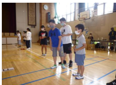
どこに投げようかな