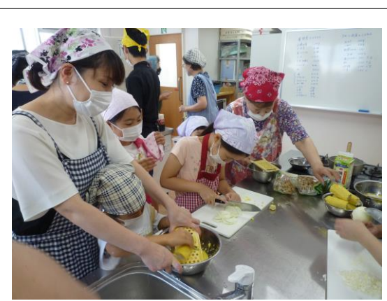
未来のカリスマシェフかも？

当日は、小中学生の親子20名の参加があり、親子がしっかりと触れ合いながら楽しく料理作りに取り組んでいました。子ども達の少し危なっかしい包丁さばきを優しく見守っているお母さん達の表情がとても印象的でした。