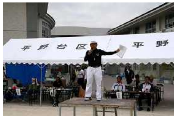
(3)開始10(競技指導=岡本同好会代表)