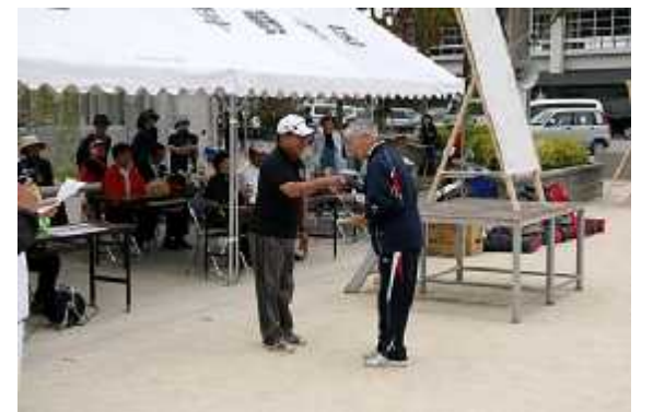
(8)成績発表08(個人優秀賞)