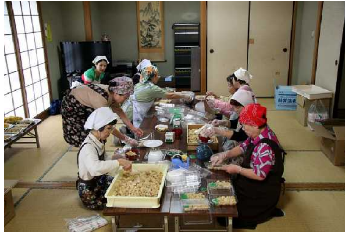
(2)炊き出し02(平野台公民館・食進会)