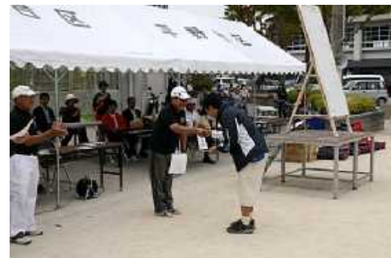
(8)成績発表11(個人優秀賞)