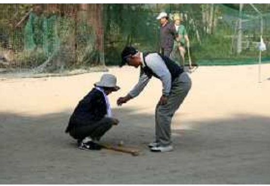
(1)練習05(平野台広場・10月7日)