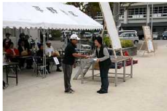
(8)成績発表09(個人優秀賞)