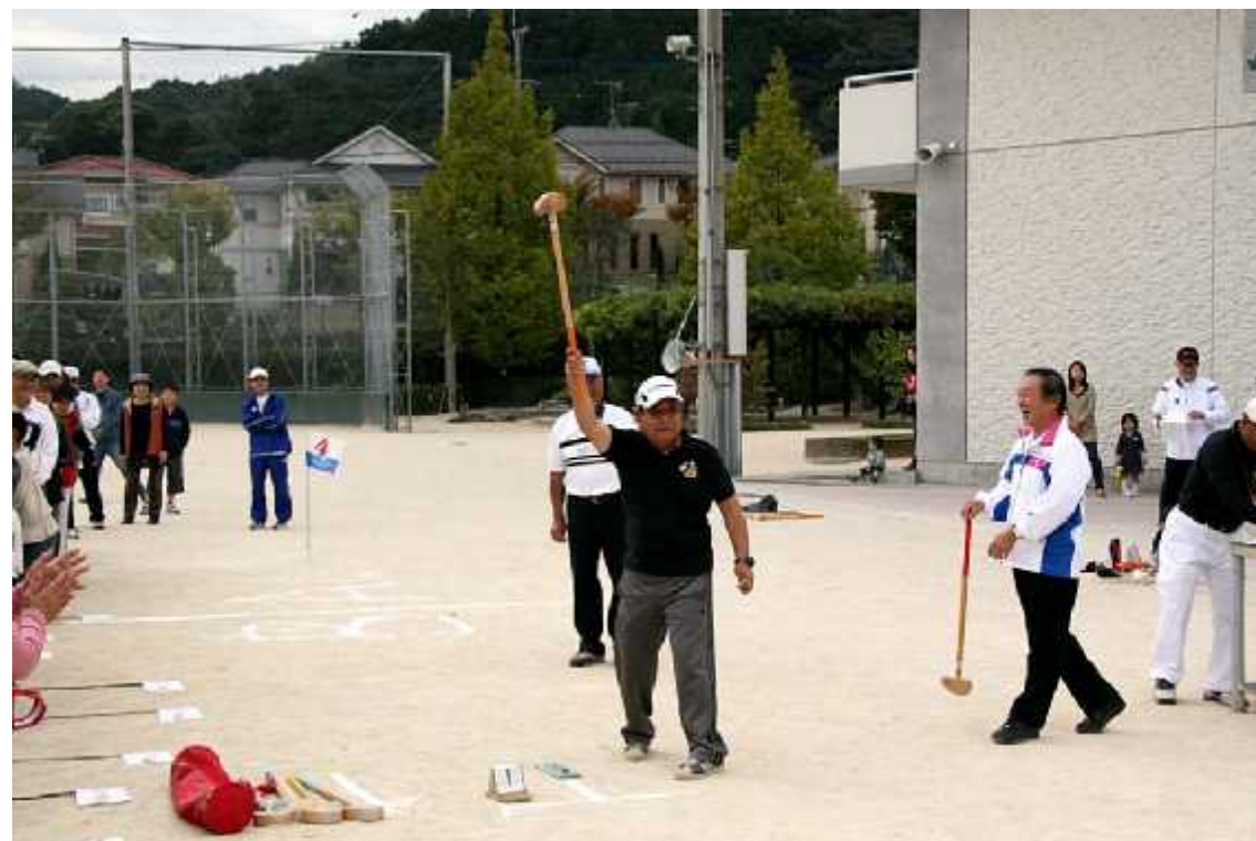
(3)開始12(号令=穴井区長)