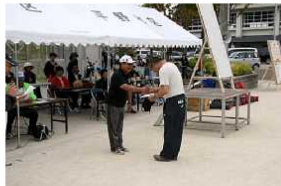
(8)成績発表10(個人優秀賞)