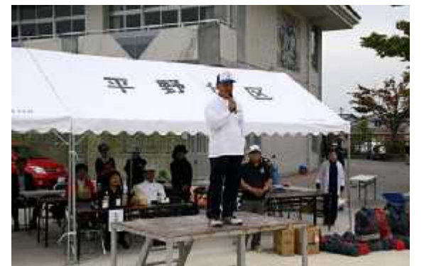
(7)終了07(終了挨拶=大倉体育部長)