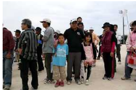
(7)終了07(スリーショット=大活躍のちびちゃん)