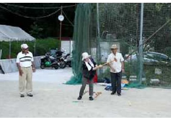
(1)練習04(平野台広場・10月7日)