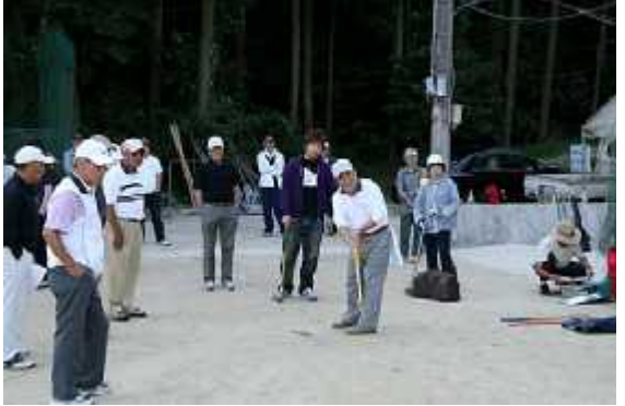
(1)練習03(平野台広場・10月7日)