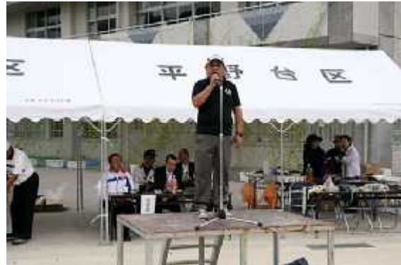
(3)開始03(挨拶=穴井区長)