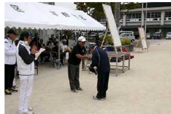
(8)成績発表07(個人優秀賞)