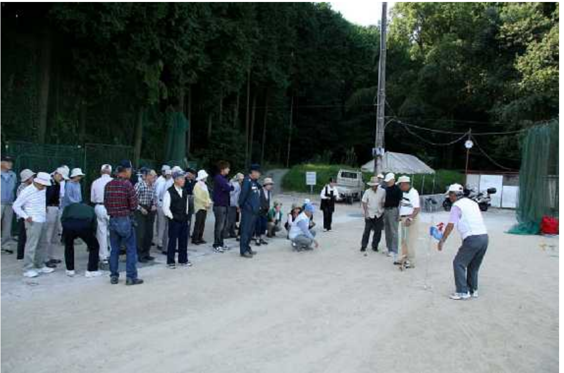
(1)練習01(平野台広場・10月7日)