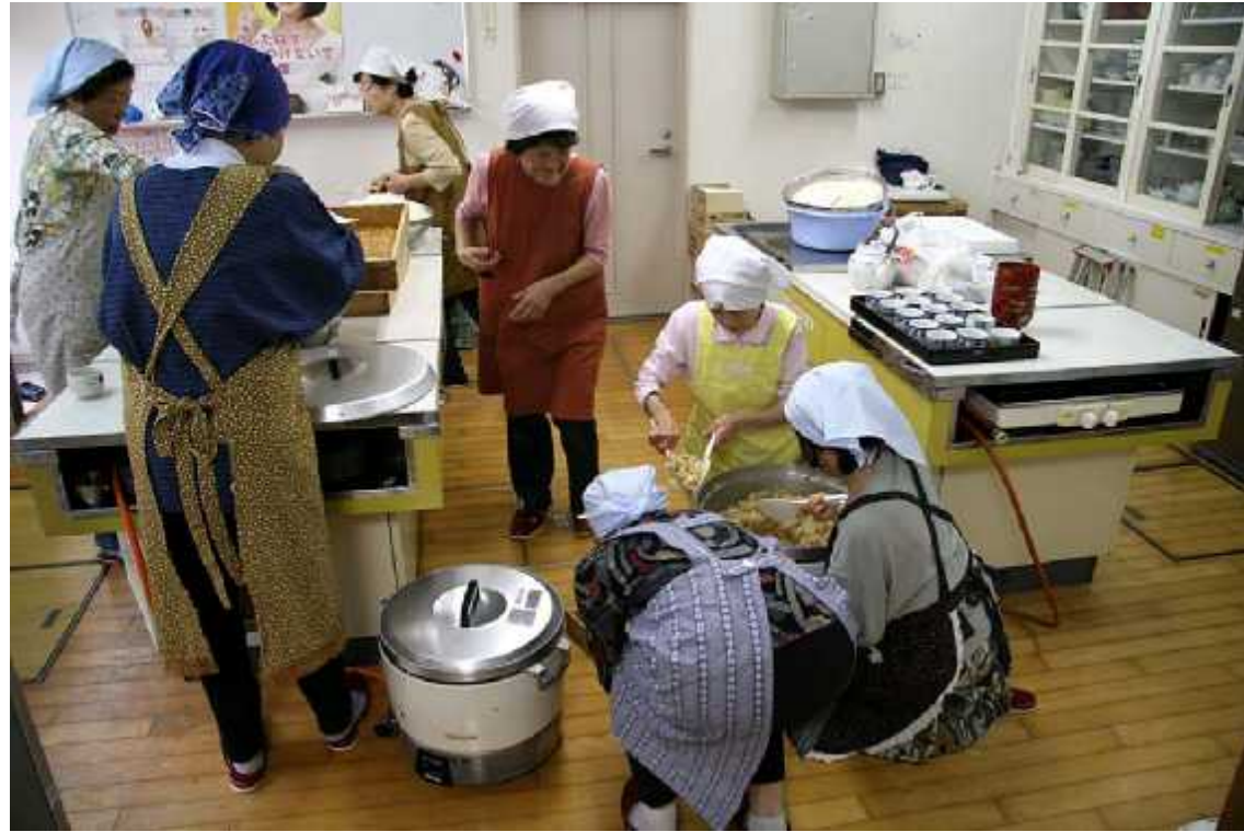
(2)炊き出し01(平野台公民館・食進会)