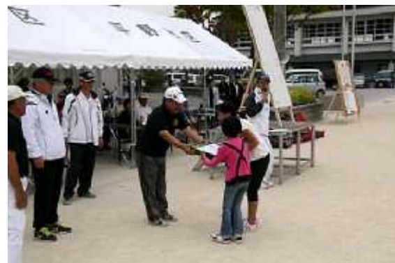
(8)成績発表05(個人優秀賞)