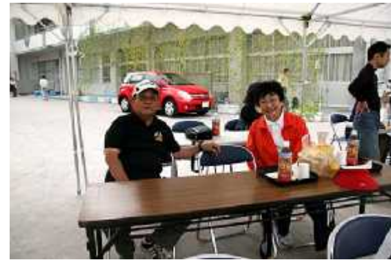
(6)競技13(ツーショット=賀来区長+穴井区長)