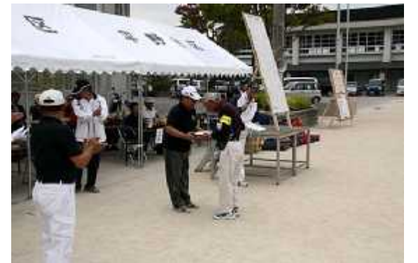
(8)成績発表03(個人優秀賞)