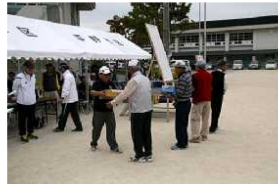
(8)成績発表02(団体優秀賞)