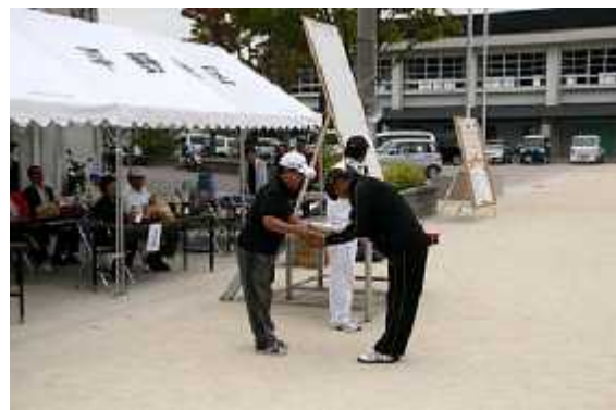
(8)成績発表04(個人優秀賞)