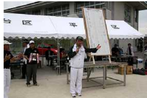
(8)成績発表01(発表=南会計役)