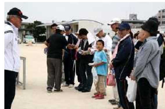
(8)成績発表12(個人優秀賞)