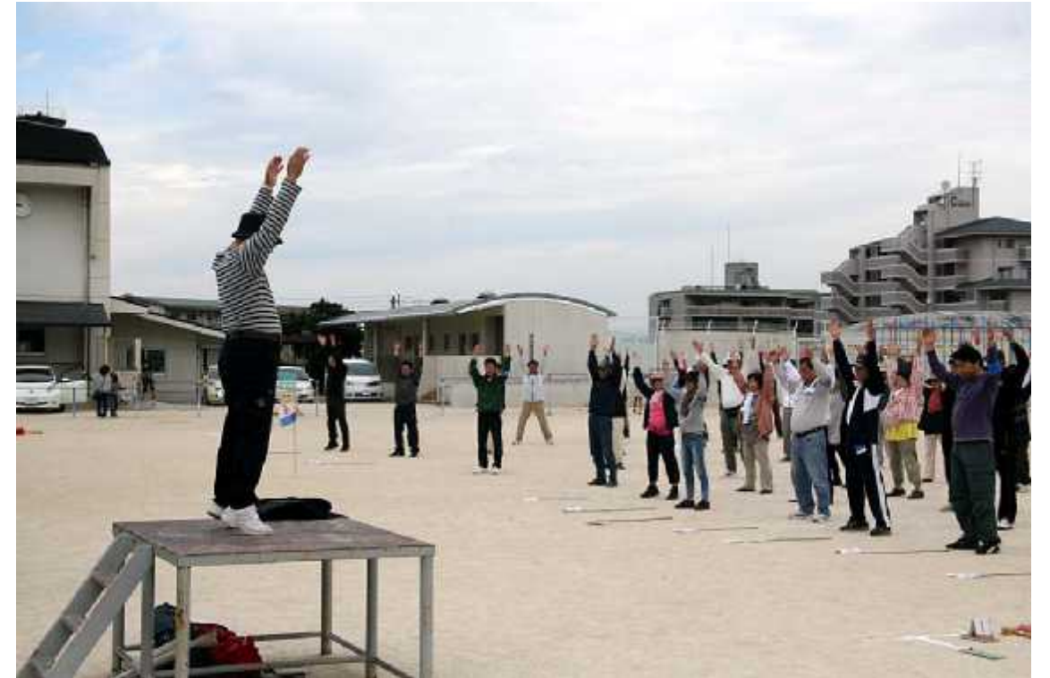
(3)開始09(体操指導=体育委員)