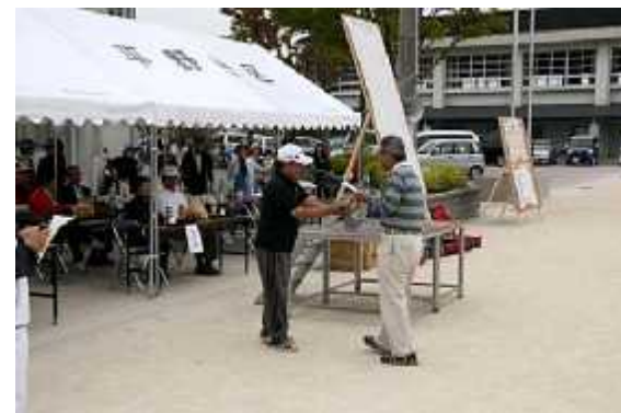
(8)成績発表06(個人優秀賞)