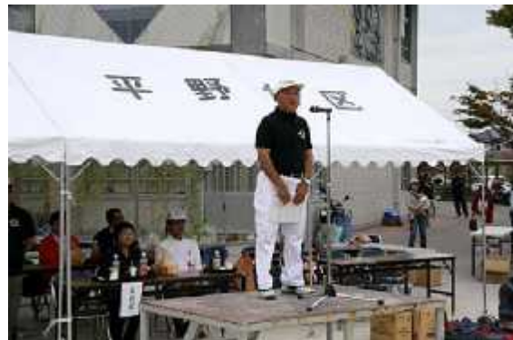
(7)終了06(競技講評=岡本同好会代表)