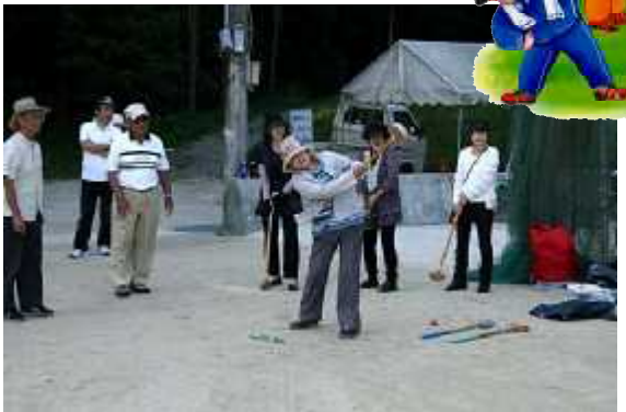
(1)練習02(平野台広場・10月7日)