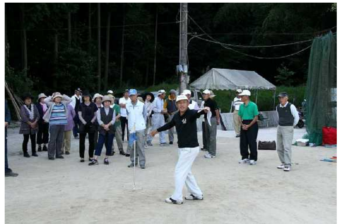
(1)練習06(平野台広場・10月7日)