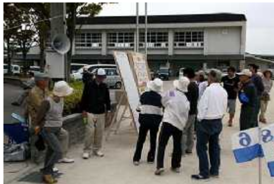
(6)競技24(成績掲示=途中)