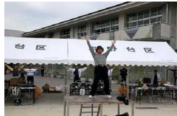
(3)開始08(体操指導=体育委員)