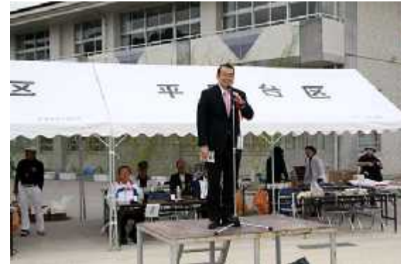
(3)開始05(挨拶=楠田衆議)