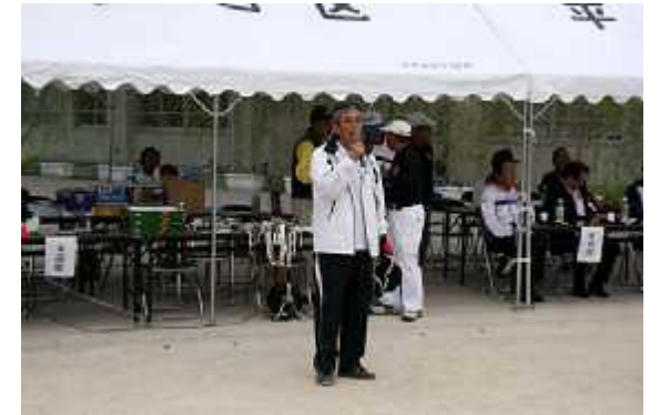
(3)開始02(挨拶=高椋代表幹事)