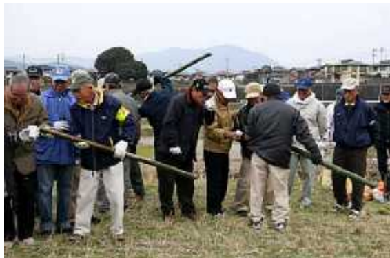
野点食堂06(カッポ酒)