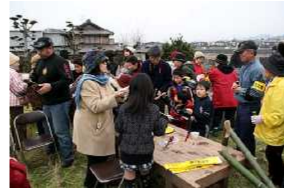
野点食堂02(ぜんざい)