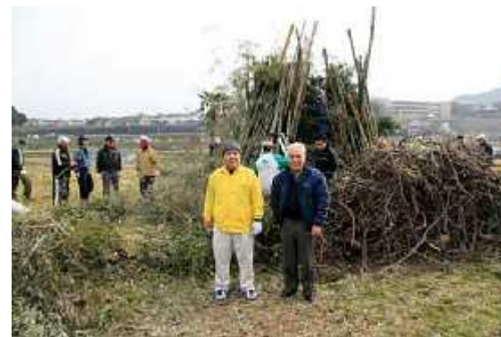
準備04(14日/山上牛頭区長往訪・設営)