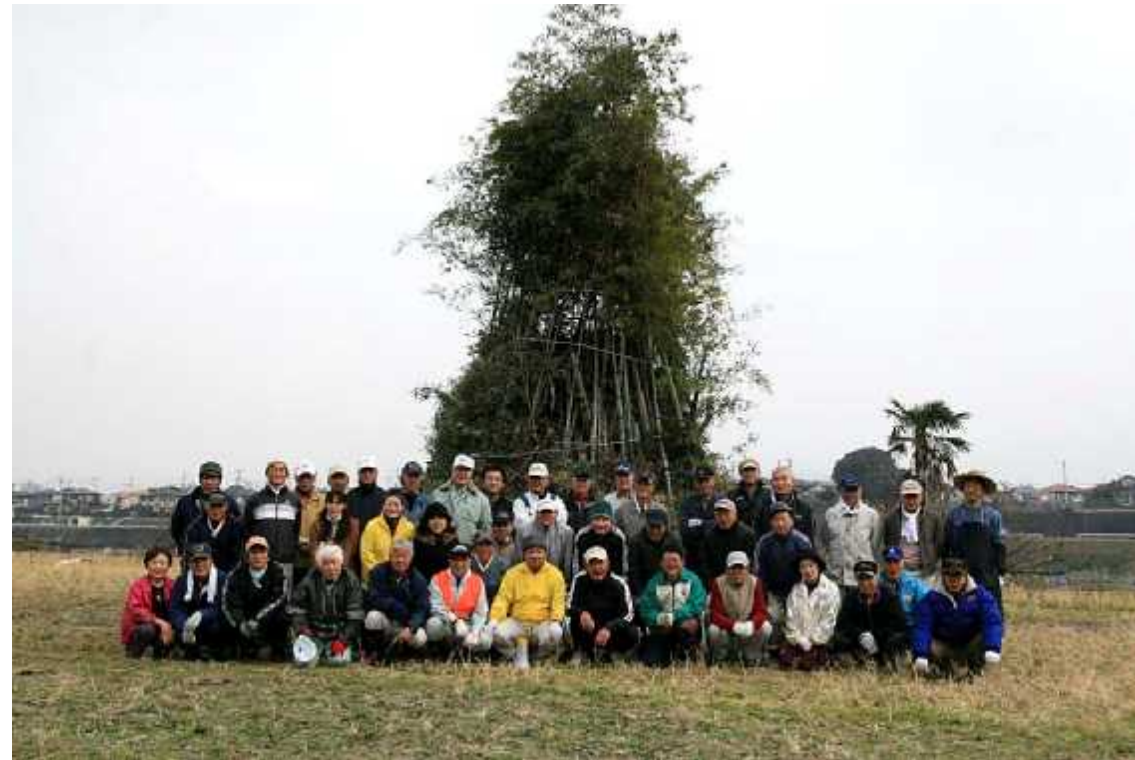
準備12(14日/協力者記念撮影・設営)