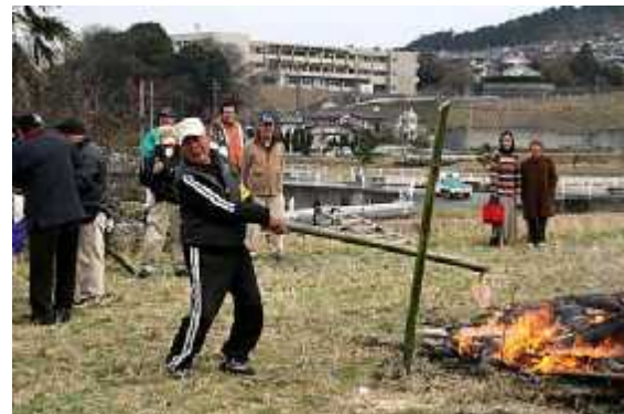
野点食堂07(カッポ酒)