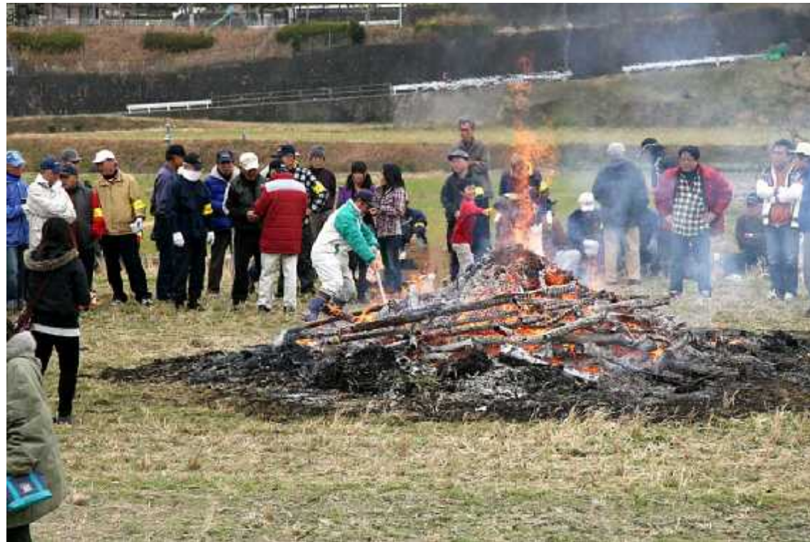
野点食堂10(山上市議手伝い・焼き芋)