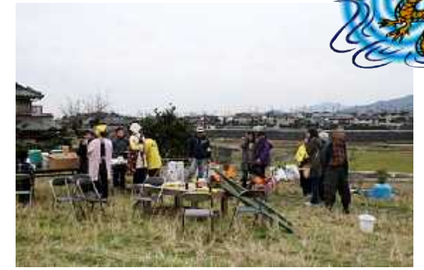
準備14(野点食堂・設営)