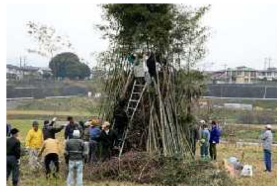
準備07(14日/山上市議手伝い・設営)