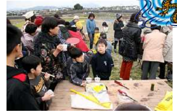
野点食堂03(ぜんざい)