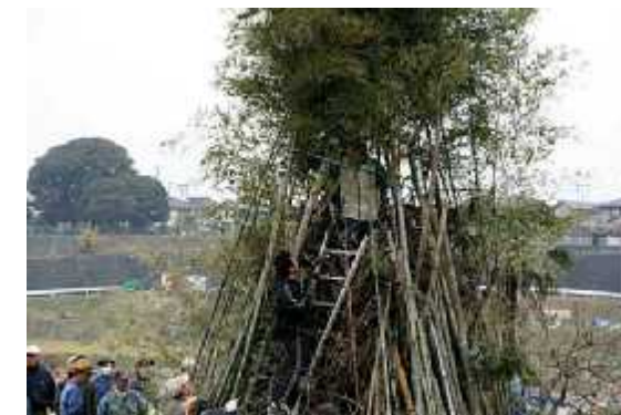
準備08(14日/山上市議手伝い・設営)