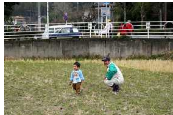
終了03(山上市議親子)