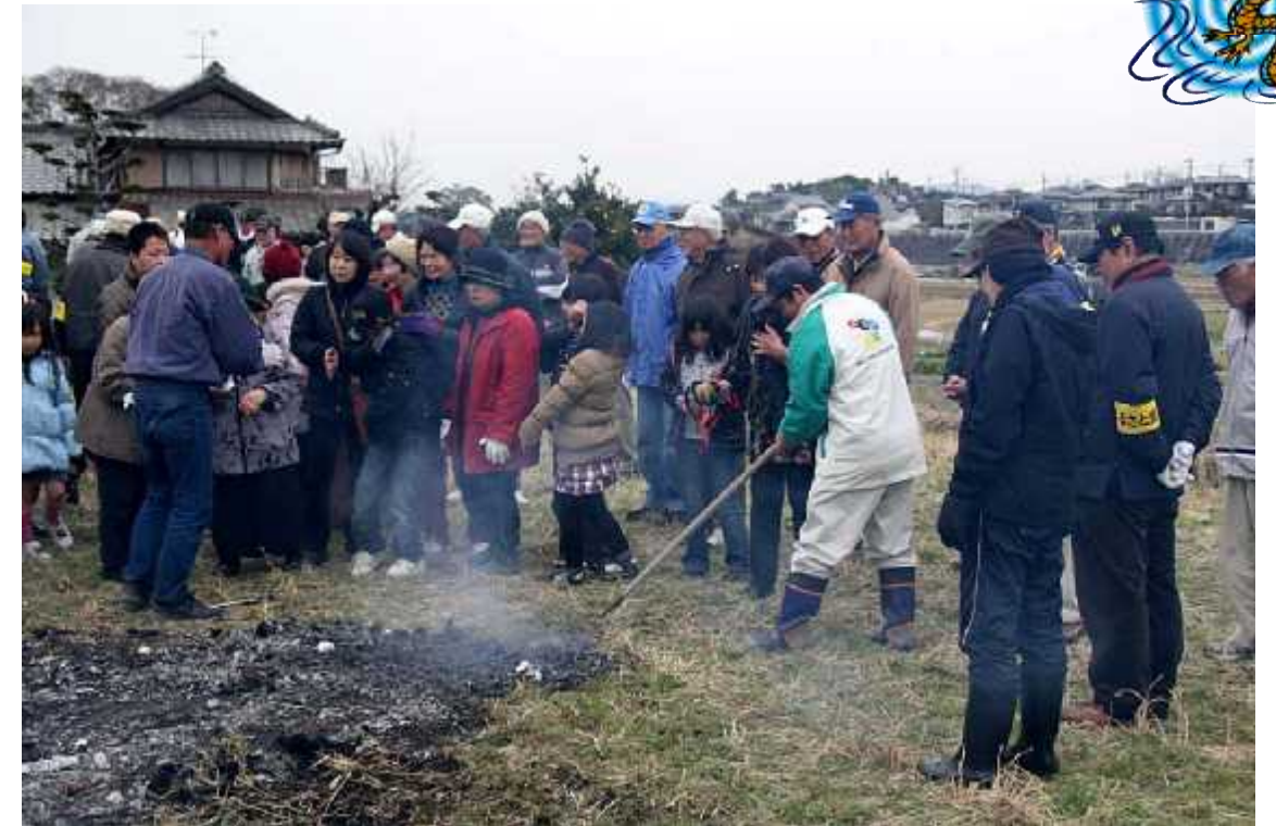
野点食堂12(山上市議手伝い・焼き芋)