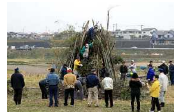
準備06(14日/山上市議手伝い・設営)