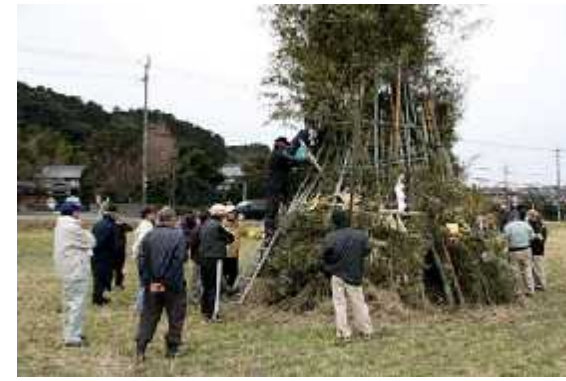
準備13(油入れ・設営)