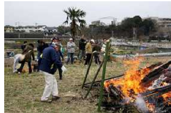
野点食堂05(カッポ酒)