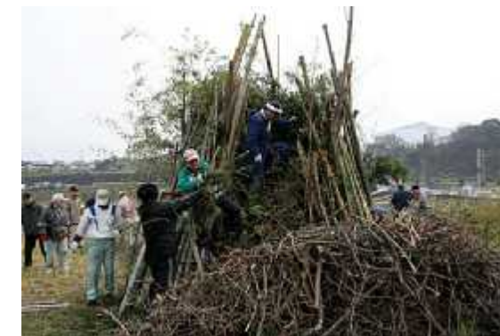
準備05(14日/山上市議手伝い・設営)