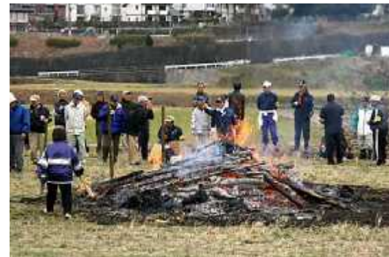
野点食堂08(カッポ酒)