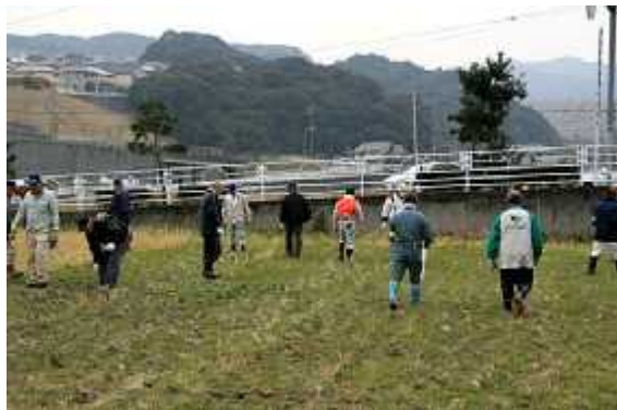
準備11(14日/山上市議手伝い・設営)