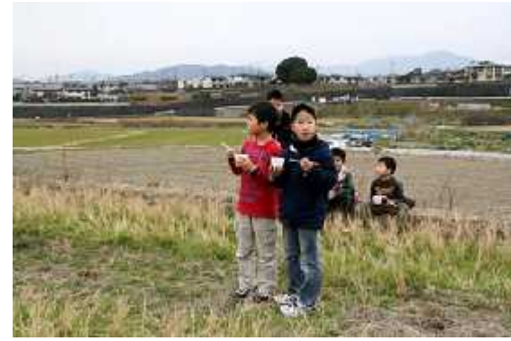
野点食堂01(ぜんざい)