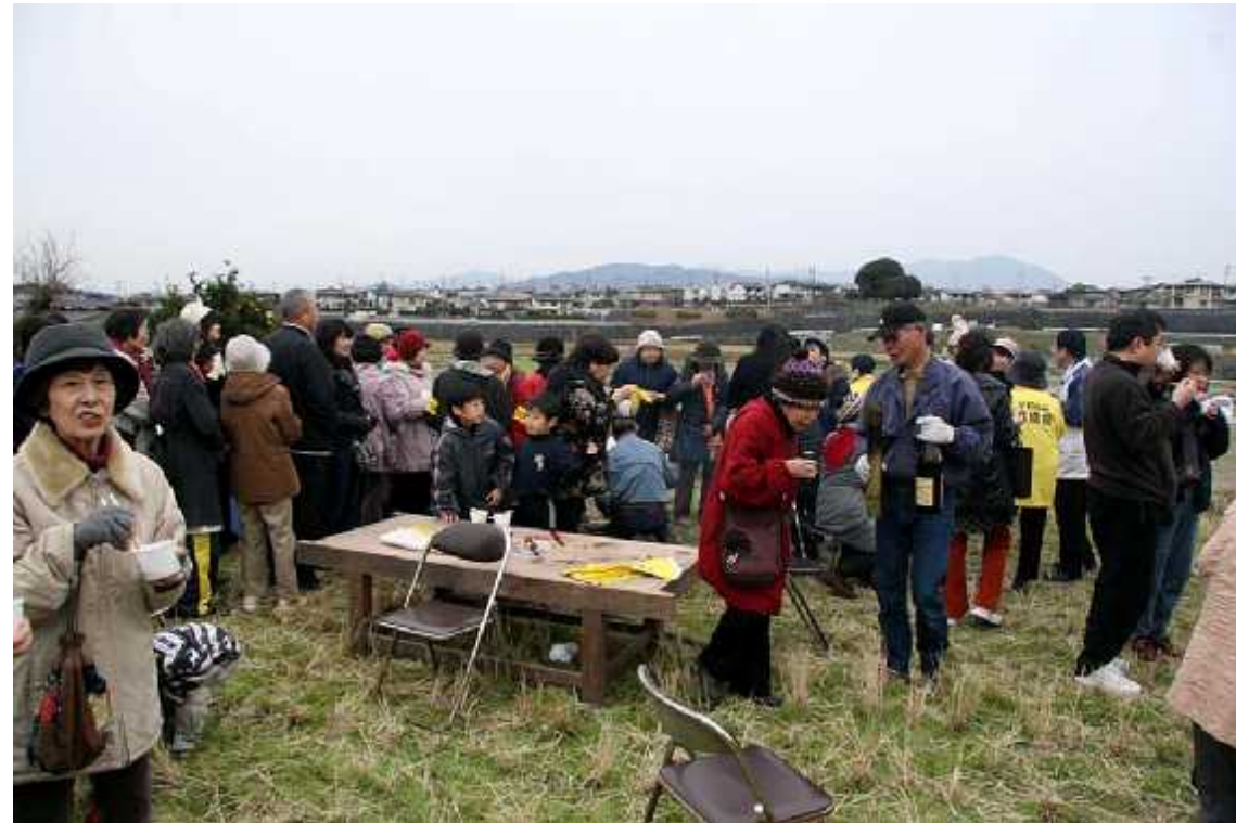
野点食堂04(ぜんざい)