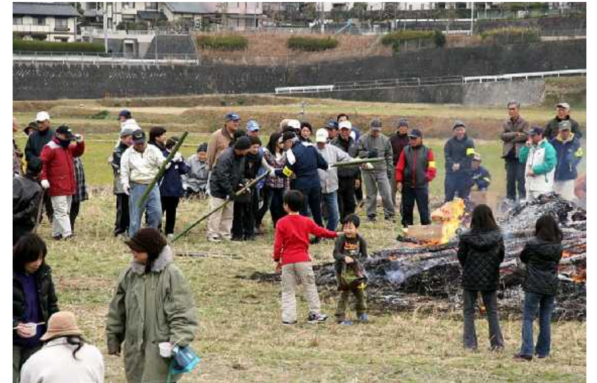
野点食堂09(カッポ酒)