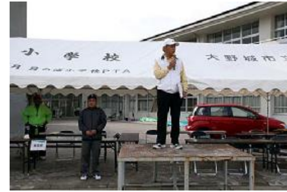
終了02(講評=山口同好会代表)