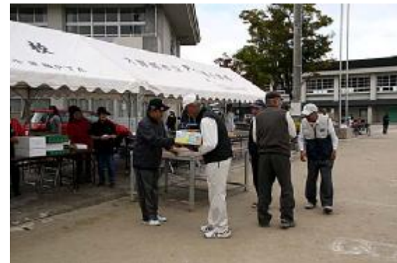
成績発表02(団体優勝=21組A)