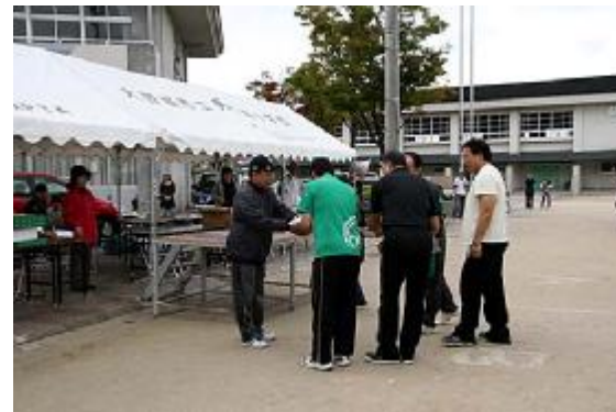
成績発表03(団体2位=月の浦小学校)