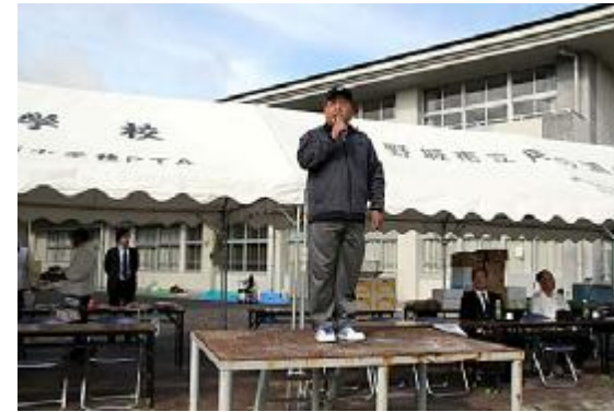
開始03 (挨拶=穴井区長)