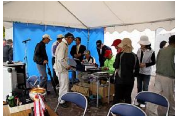
競技13(途中集計=同好会)