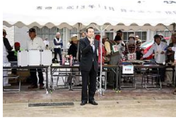
競技18(挨拶=楠田衆議)