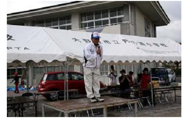
終了03(閉会辞=大倉役員)