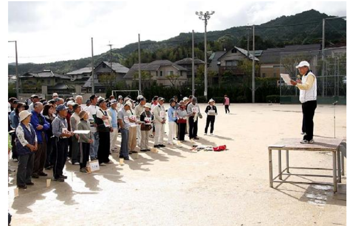
開始09 (競技指導=山口同好会代表)