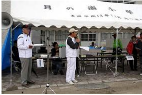
成績発表05(進行=南会計役)