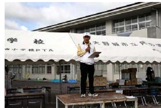
開始08 (競技指導=山口同好会代表)