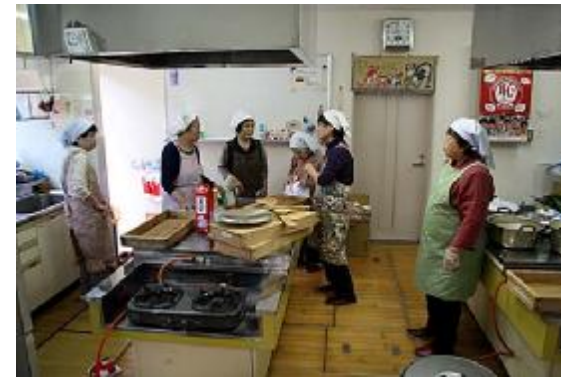
炊き出し02 (平野台公民館・食進会)