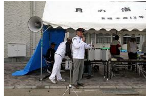
終了01(進行=石橋主事)