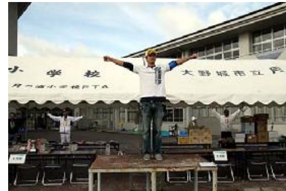
開始07 (体操指導=溝口体育委員)