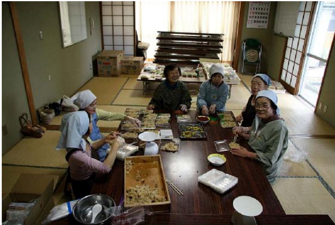
炊き出し01 (平野台公民館・食進会)