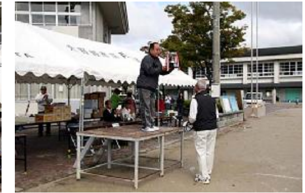
開始05 (優勝杯返還=21組)