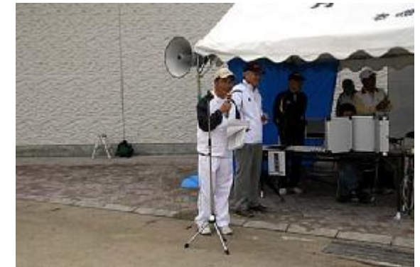
成績発表01(進行=南会計役)