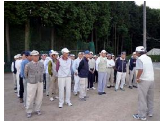
練習01(平野台広場・10月16日)