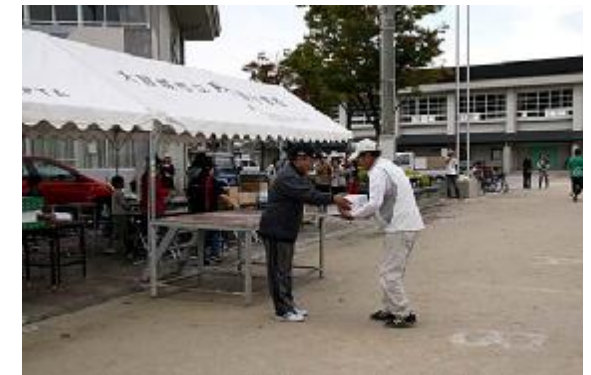
成績発表04(団体3位=25組)