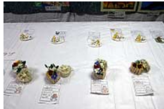
月の浦小学生作品=立体07(文庫の部屋)