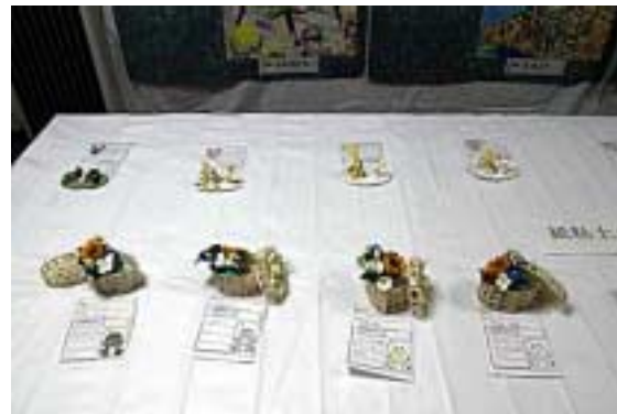
月の浦小学生作品=立体08(文庫の部屋)