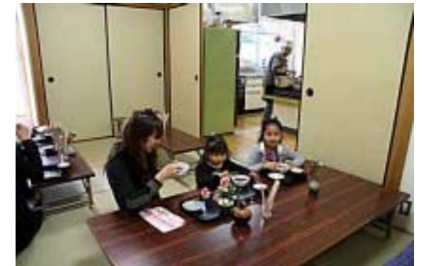
ぜんざい食03(月の浦小学生・他)