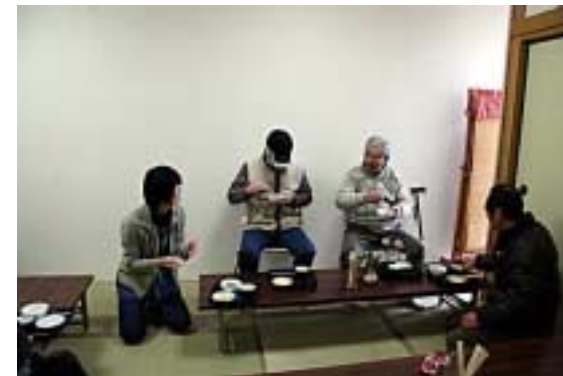
ぜんざい食05(なごやか日記)