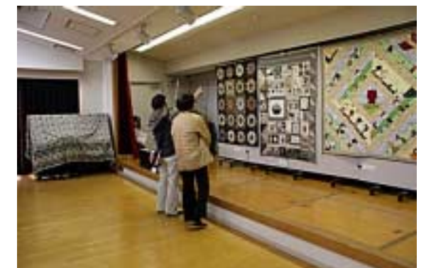
舞台エリア出品01(全景:集会室)