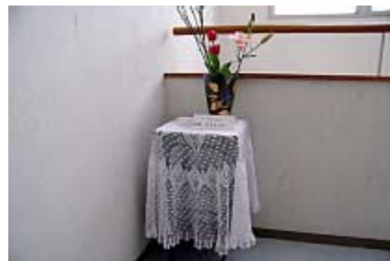
手芸=テーブルクロス01(廊下)