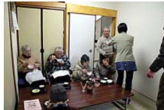
ぜんざい食04(なごやか日記)