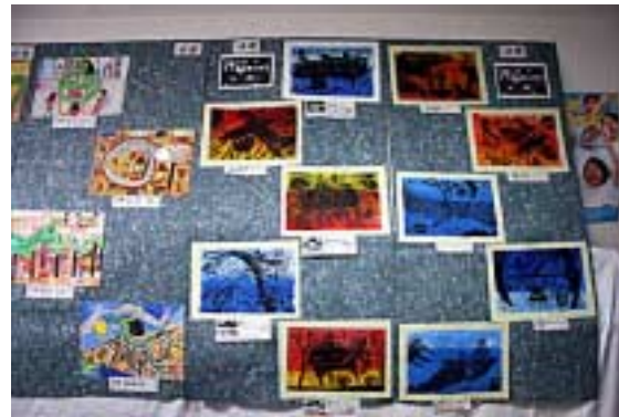
月の浦小学生作品=平面03(文庫の部屋)