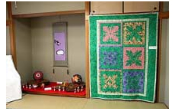
工芸・手芸01(全景:憩いの部屋)