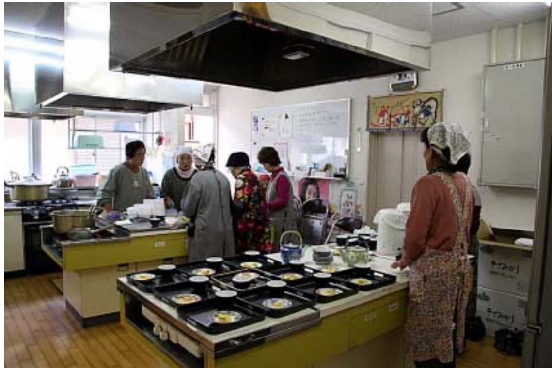
ぜんざい制作01(食進会・他:調理室)