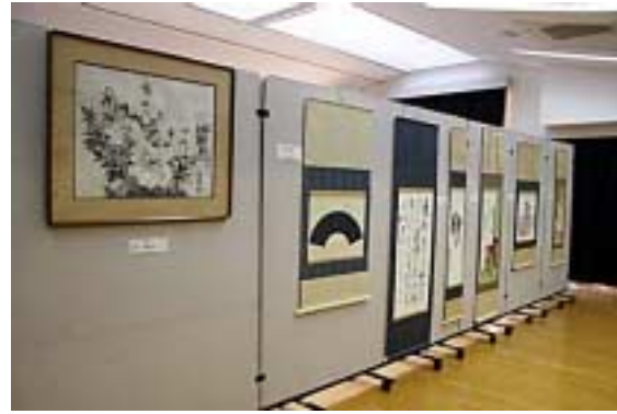
絵画・書・工芸01(全景:集会室)