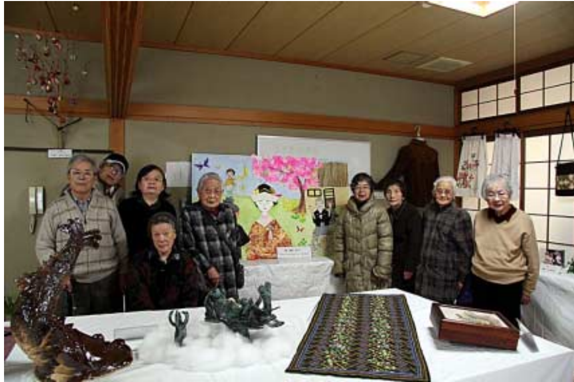
工芸・手芸24(なごやか日記)