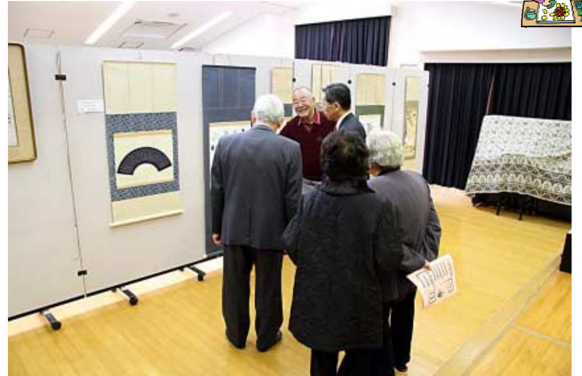
絵画・書・工芸05(古田・井本市長・古市区長)