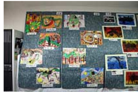
月の浦小学生作品=平面04(文庫の部屋)