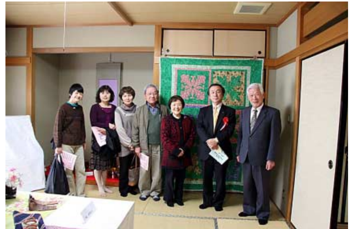
工芸・手芸23(山本・井上県議・古市区長・他)