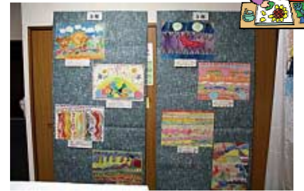
月の浦小学生作品=平面02(文庫の部屋)