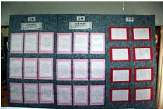
月の浦小学生作品=平面06(文庫の部屋)