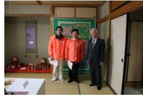
工芸・手芸26(山上氏・古市区長・他)