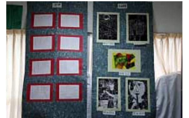
月の浦小学生作品=平面05(文庫の部屋)