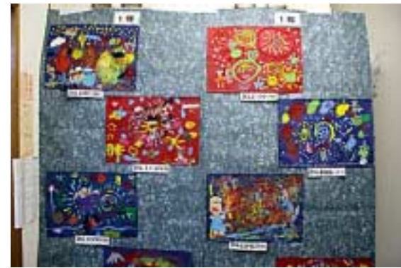
月の浦小学生作品=平面01(文庫の部屋)