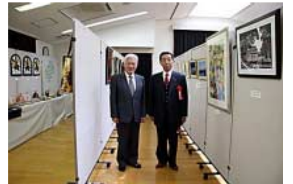
絵画15(井本市長・古市区長)