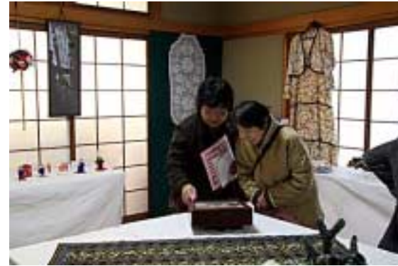
工芸・手芸25(賀来区長・他)