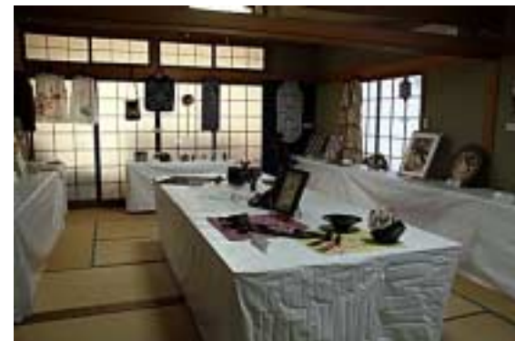
工芸・手芸05(全景:憩いの部屋)