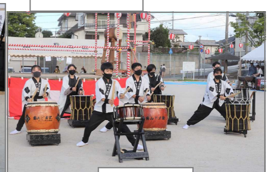
勇壮な南ん子太鼓