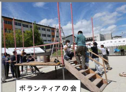
ボランティアの会やぐら作り