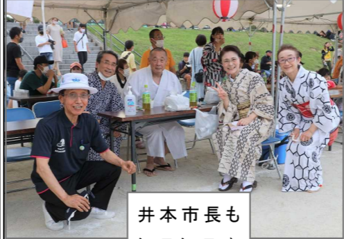
井本市長もにこにこ♪