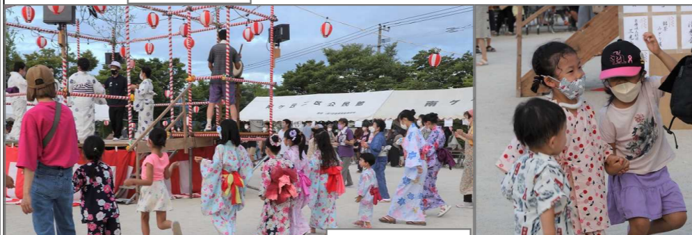
かわいい踊り子さん達