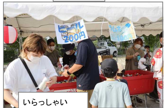
いらっしやい いらっしやい！