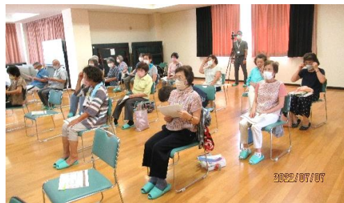
認知症の基礎知識、声かけレッスン