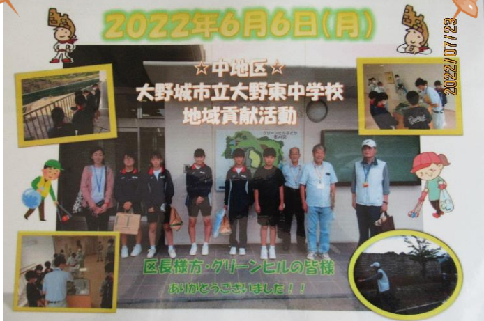
グリーンヒルまどか(福岡都市圏南部最終処分場)を見学しました