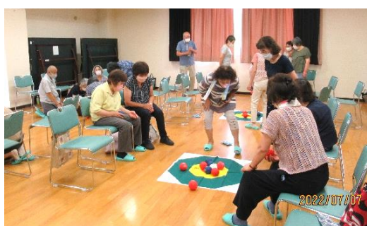
レクリエーション：ポッチャ