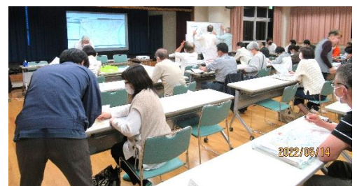
マイ・タイムラインの作成練習