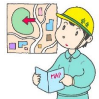
中区には土砂災害警戒区域・洪水浸水想定区域が広く分布しています