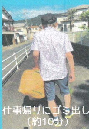
仕事帰りにゴミ出し (約10分)