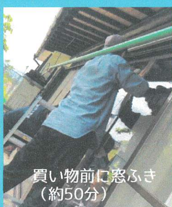
買い物前に窓ふき (約50分)