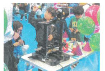
3Dプリンタによる実演体験