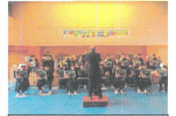
大野東中学校吹奏楽部

にぎわいづくり協議会によるバザーブースにはたくさんの美味しいお店にご出店いただき、大変好評でした。