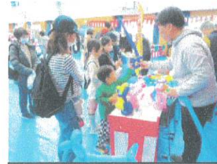
各区の縁日ブース