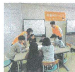
こども商店街「お仕事体験」

11月19日(日)、東地区コミュニティ運営協議会主催、東パートナーシップ活動支援センター、イオン九州(株)乙金店の協賛により「わくわくキッズフェスタin東コミ」が東コミュニティセンターにて開催されました。