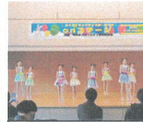
キッズダンスの披露