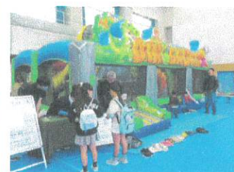
イオン九州(株)乙金店によるトランポリン