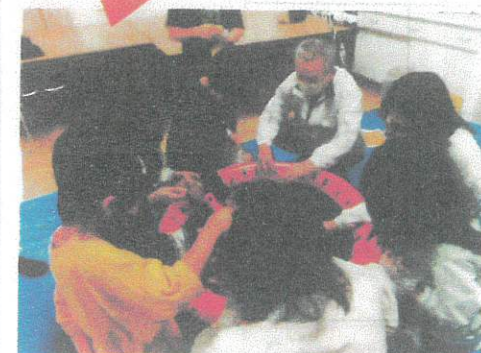
ぶよぶよボールすくい