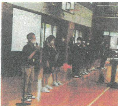
開会式！お手伝いしてくれた大野東中学校の皆さまと♪

6月4日(日)、東コミュニティセンターにて『乙金区スポーツ大会』を開催いたしました。今年の競技は、フライングディスク、わなげ、ストラックアウト、ユニカール、五目お手玉、綱引きの競技で皆さん楽しまれました。103名の参加者の方々が熱戦を繰り広げました♪