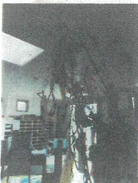
みんなの願い事がかないますように♪