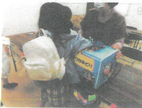
うまい棒つかみどり

来年の『春かごめの会』も、春頃開催予定です。回覧板や乙金区の公式ラインで告知いたしますので、チェックしてくださいね!!