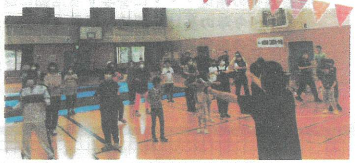
『大文字体操』覚えてくれましたか？