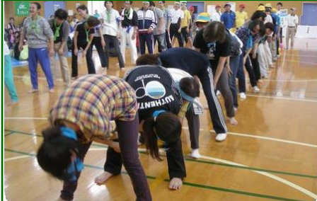
ブロック長、隣組長、副隣組長さん出番ですよ