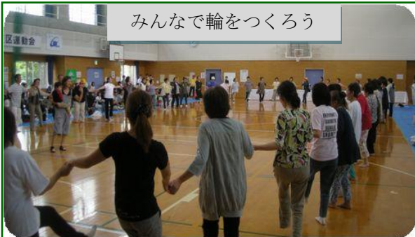
みんなで輪をつくろう