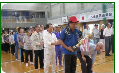
準優勝の2ブロック