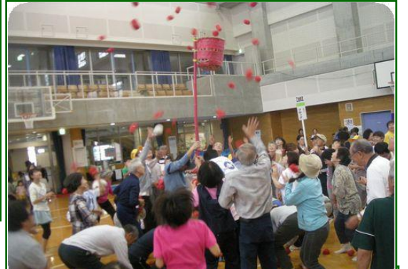
ブロック対抗玉入れ