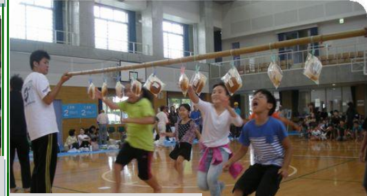
それゆけアンパンマン