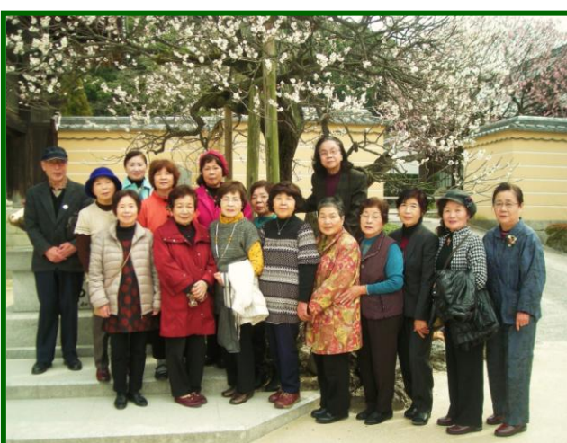
ボランティア若葉会一同

その後、一路太宰府へ。お天気にも恵まれ、梅花も満開で有意義な研修の一日となりました。今後も、皆様のご協力で「わかばつ子」が発展しますよう願っております。