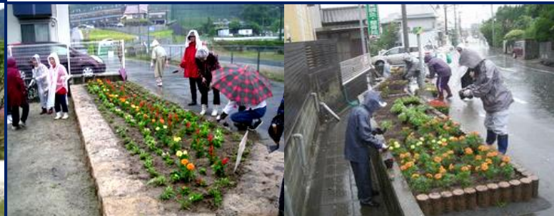
6月、11月 花いっぱい運動