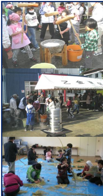
12月 餅つき大会(上2枚) しめ飾り作り(下)