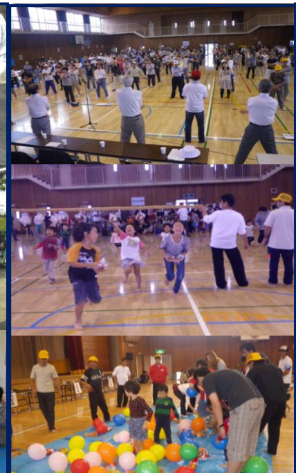
9月 第6回乙金東区運動会 乙金東区民の連帯ふれあい