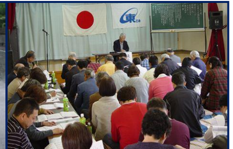
4月 乙金東区定期総会開催