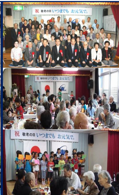
9月 敬老会 華やかに敬老祝賀会開催