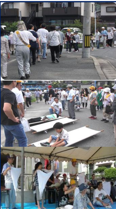
9月 自主防災訓練 災害に備えて