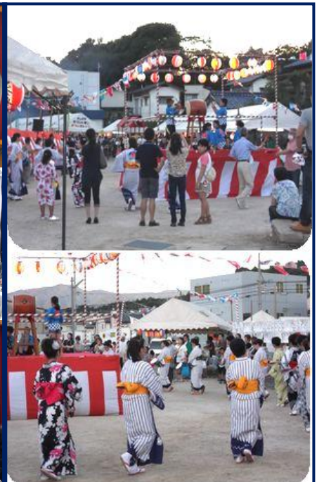
8月 夏まつり 区民総出の一大イベント