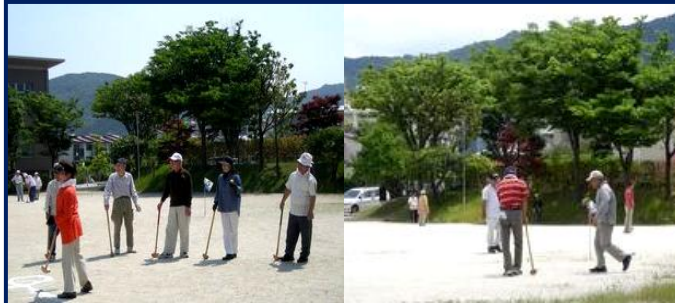
5月、6月 ブロック別 親善グラウンドゴルフ大会