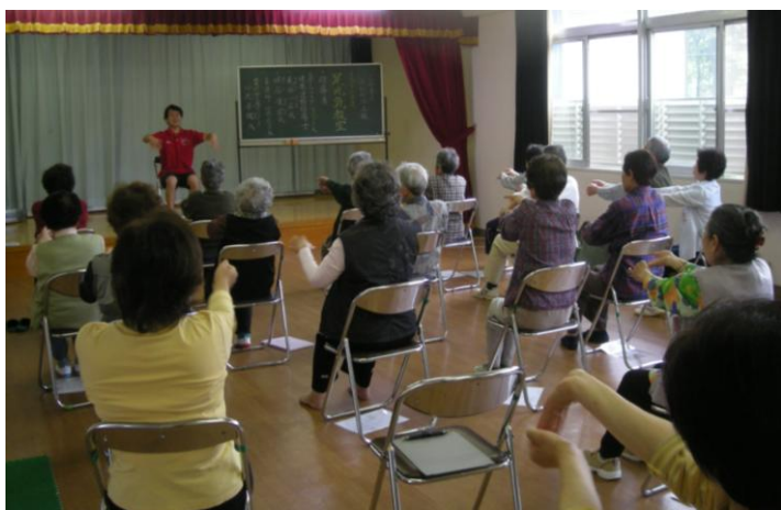
《足元気教室》 回を重ねる毎に参加者が増えています

日頃の運動不足を皆さんと楽しく過ごしてみたいは如何でしょうか。月に1回のペースですので、お気軽に参加して下さい。お待ちしております