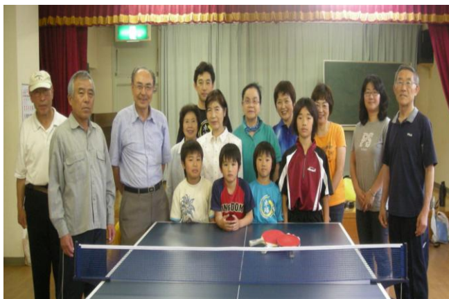
平成22年5月22日(土)より卓球開始