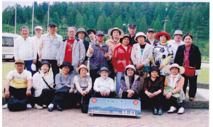
シニアクラブ《春の旅行》 5月8日～9日