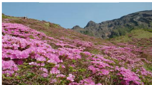
《仙酔峡》 ミヤマキリシマ

旅立ちはいくつになってもなやまら心ときめくものである。晴天、薫風の中、総勢44名の皆さんで、バニー前に待機中の2台のバスに乗り込んだ。まずは、山鹿千代の園の蔵元へ、上戸には何とも応えられない試飲があり、いきなり19度の利き酒で「あ」とん酒は水のごたるばい」とおっしゃるつわものも。下戸の皆さんは甘酒や高級銘茶で接待を受けた。次に、みずどり菊池でランチタイム。おつくり、吸い物、茶碗蒸しと昼とは思えぬ豪華版に大満足。駄馬つづく阿蘇街道の若葉かな(漱石) 菊池、阿蘇ミルクロードを経て阿蘇いこいの村へ、間近に根子岳、高岳を望むホテル到着。入浴後、5月定例会、恒例お誕生会の後、いよいよメインイベントの大?宴会。民謡あり演歌ありで、おおいに盛り上がった。ホテル専属の踊り子さんも花を添えてくれた。翌、朝食後ゴルフ組、観光組(仙酔峡・阿蘇神社)に分かれた。昼食時ゴルフの表彰