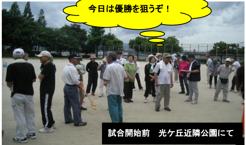
今日は優勝を狙うぞ!