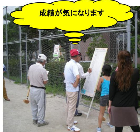
成績が気になります