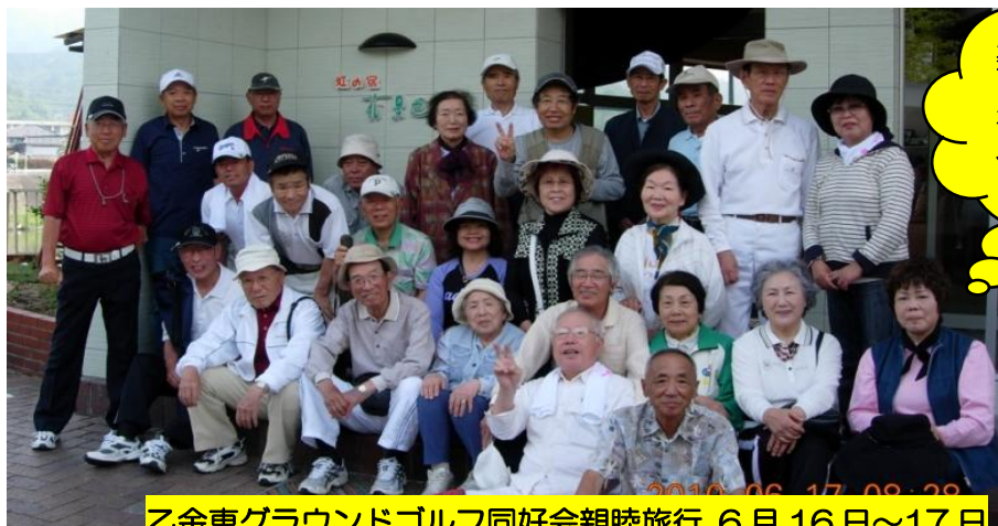
乙金東グラウンドゴルフ同好会親睦旅行 6月16日～17日