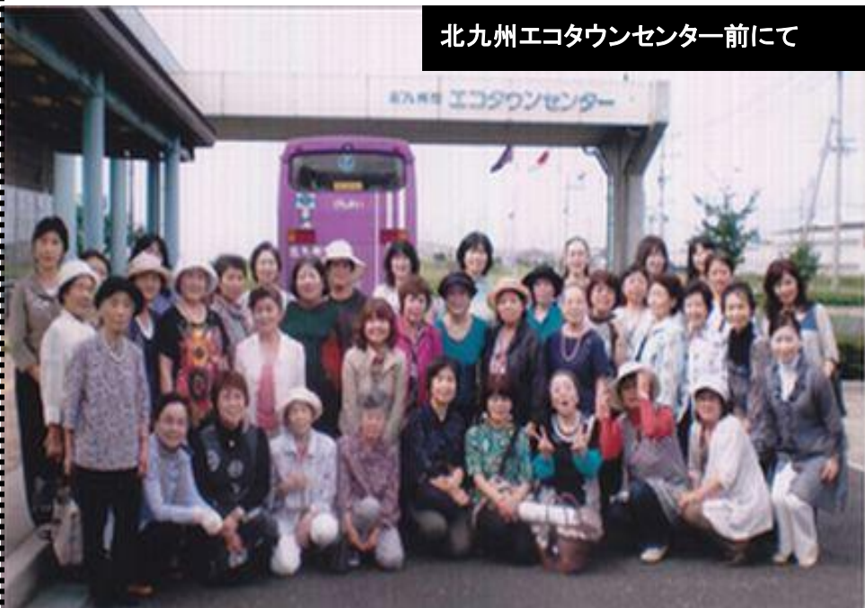
北九州エコタウンセンター前にて