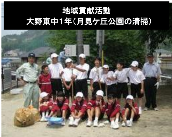
地域貢献活動 大野東中1年(月見ヶ丘公園の清掃)

例年この時期に大野東中学校1年生が自分達の住んでいる地域内で何か貢献出来ることはありませんか？と区へ尋ねてきます。乙金東区では毎年月見ヶ丘公園の清掃作業を行ってもらっています。今年も14名の新1年生が去る6月3日(金)に公園の清掃をしました。参加者全員より感想文をいただきました。