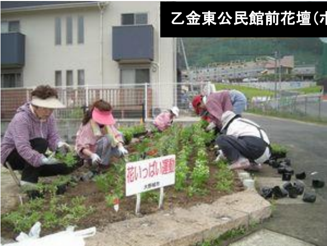
乙金東公民館前花壇(ボランティア若葉会)