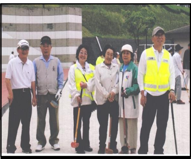
乙金東シニアクラブの皆さん

6月7日(火)曇り。場所は、まじかパーク多目的グラウンド。9時開始、参加人数270名。4つのコースに分かれ、乙金東から2チーム12名と記録者2名の計14名で参加しました。フェアプレーに心掛けて和やかなプレーで、今日一日悔いのないグラウンドゴルフを楽しみました。合言葉にプレーしました。その結果36チームの中で、5位と10位という成績を取ることが出来ました。乙金東シニアクラブ お疲れ様でした。