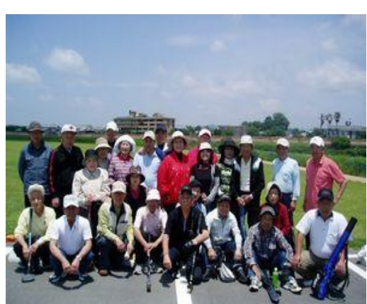
菊池川河川敷芝生コースにて

去る5月29日、30日、台風2号が鹿児島地方に近づく中、ホテルかんぼの宿「山鹿」の送迎バスに参加者27名乗り込み出発。高速道路を走行中、小雨が降り続いていましたが、目的地の山鹿に着いた頃、雨も上がりほつとしました。昼食後、早速ホテル前のグラウンドで記録会(3ゲーム)を行い、ホールインワンも多数出て楽しいゲームでした。ゲーム終了後天然温泉にて旅の疲れをとり、夕食会が宴もたけなわの頃に、ビンゴゲームやカラオケにて又一段と山鹿の夜を楽しみました。翌日、菊池川河川敷芝生コースでの記録会。天候は曇りでしたが、前日からの雨のため所々水溜まりがあり、強打したボールも思うように飛ばず参加者全員、悪戦苦闘のゲームでした。昼食後帰りのバスに乗り込み次回旅行を夢見ながら山鹿を後にしました。