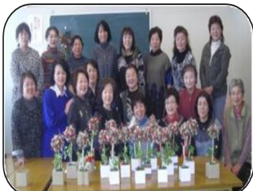
出来上がった作品の前で記念写真とても楽しい講座でした

今回はクリスマスバージョンでしたが、マイバージョンで変化を楽しんでみては如何でしょうか。