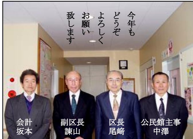
今年もどうぞよろしく お願い致します