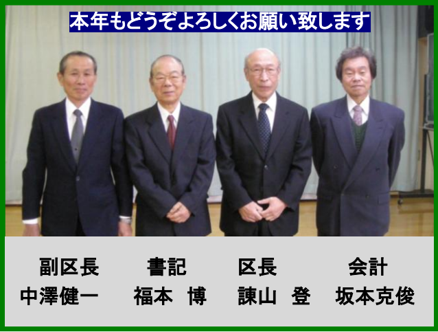
本年もどうぞよろしくお願い致します