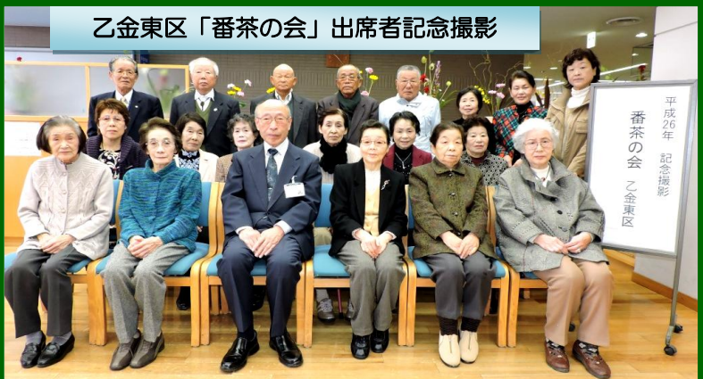
乙金東区「番茶の会」出席者記念撮影

しみにしている」とのお声をいただき、憩いの一時を お過ごしになったと思います。 参加者の皆様、関係者の皆様、大変ありがとうございました。