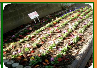
1丁目掲示板前花壇