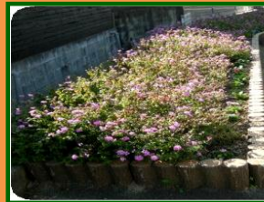
安東整骨院前花壇