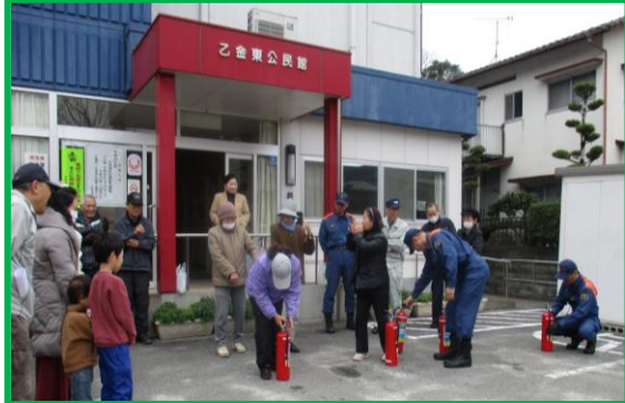
◎消火に関するお問い合わせ先 春日・大野城・那珂川消防署東出張所 ☎092-504-7119