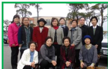
ボランティア若葉会 参加者

3月11日(金)、城南区の「子どもプラザ」と那珂川町の「ふれあい子ども館」に研修に行つてまいりました。子どもプラザは城南保健所の2階に有り、0才〜4才を対象に「積み木の部屋」や「親子さん達が自由に遊べる部屋」等が有り、皆好き好きに遊んだり、食べ物も持ち込みOKとの事で、自由に食事をされました。その後は、魚徳(春日市)で昼食を取り、那珂川町に移動。14時より15時30分迄「ふれあい子ども館」で研修となりました。正式名称は「那珂川町複合児童福祉施設」です。規模も大きく、就学前の子どものための保護者を対象にしたイベントやプログラム、小学生の遊び場を提供する施設で、平日にもかかわらず、大勢の親子さん達が楽しそうに遊んでいました。今回もいろいろなる事を学ばせていただき大変勉強になりました。