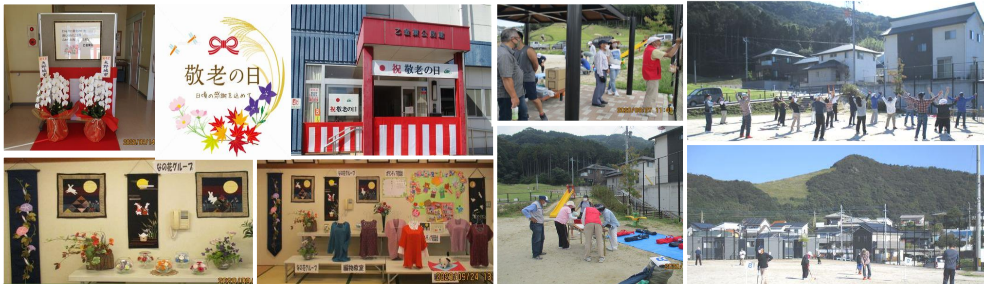
9月 「敬老の日」 祝いコーナー設置：作品展示