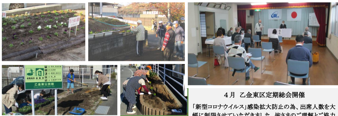
6月、11月 花いっぱい運動

「新型コロナウイルス」感染拡大防止の為、出席人数を大幅に制限させていただきました。皆さまのご理解とご協力ありがとうございました。