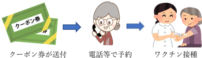
《新型コロナウイルスワクチン接種の流れ》