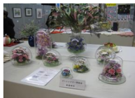
(文化祭出品された作品)