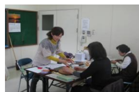
(なごやかな教室の様子)