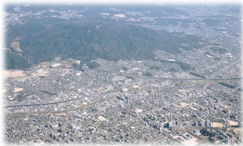
(中央地区、水城、四王寺山を望む)