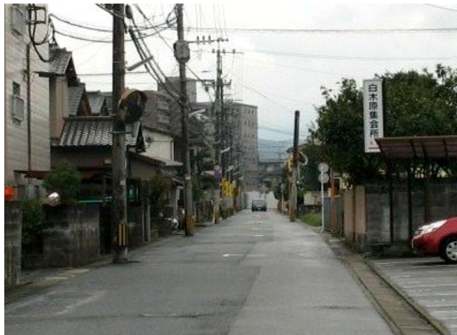
白木原集会所前の通り

町往還上組、下組は大宰府往還沿い、村はお宮（地祿神社）付近、四軒屋はその中間です。その外は田畑が広がっていました。ちなみに昭和 20 年代までは白木原の部落から西鉄下大和駅までは家はありませんでした。この道の両側は田畑で、のどかな農村風景が広がっていました。