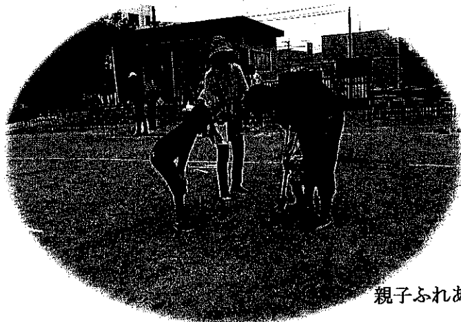
親子ふれあい軽スポーツ