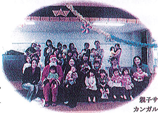
親子サロン カンガルー広場