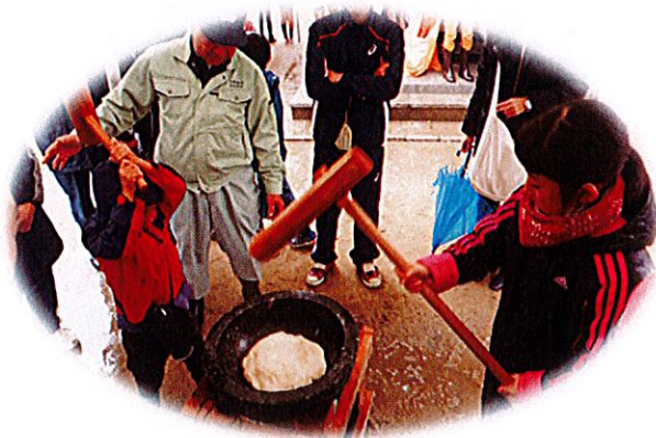
下筒井区餅つき大会 「新しい一年を迎えましょう!!」