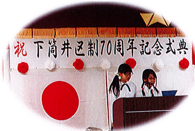
下筒井区制70周年記念式典 「私たちのまちづくり宣言」