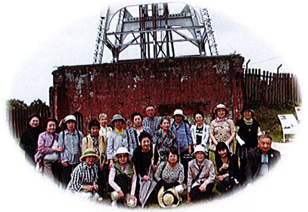
ミニデイバスハイク 「日本の近代化を支えた世界遺産 宮原坑」