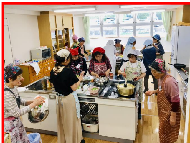
新しい調理室でウキウキ♪

実は、写真のツバメの巣は今年2つ目に作られたもの。一つ目はヒナ共々カラスに襲撃され跡形も無くなりました。しばらくは皆心配していましたが、親鳥は再び飛び回り立派な巣をつくっています