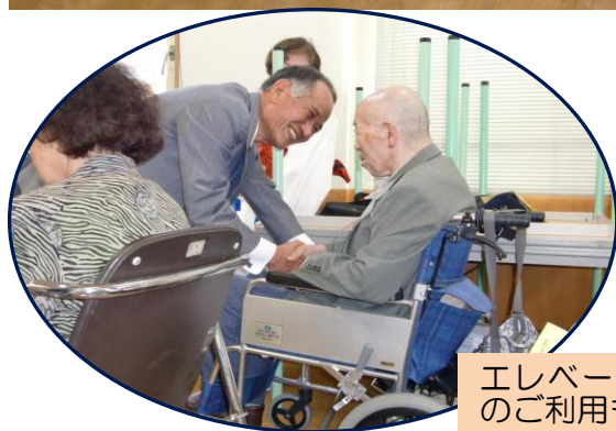
エレベーターの完成で車いすの方のご利用もしやすくなりました