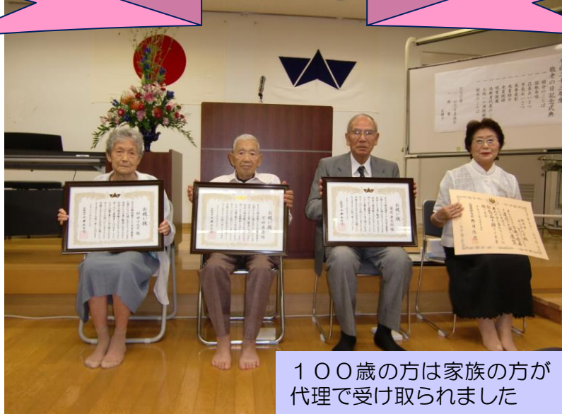
100歳の方は家族の方が代理で受け取られました