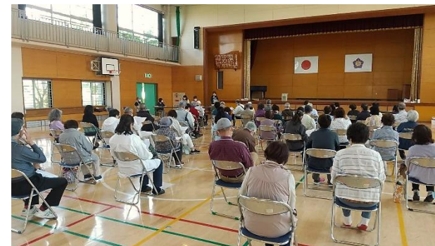
月の浦小学校体育館にて 4月25日(日)

コロナウイルスの感染拡大防止の為、小学校体育館をお借りして、総会を開催することが出来ました。おかげさまで決算、予算、役員選任、事業計画などが承認されました。令和3年度の新しい計画では世代間交流と健康づくりとして5月6日の朝6時半から(平日)近隣公園でラジオ体操を行う案も承認されました。昨年度、平成の会の運営にご尽力いただいた方々に感謝状を贈呈させて頂きました。その後、レクリエーションとして五目お手玉を楽しみました。多くの皆さんが楽しめる平成の会にしていきます。