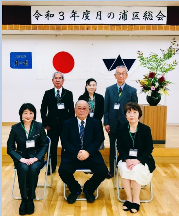
令和3年度月の浦区総会

お子さんからお年寄りの方まで気軽に足を運んでもらえる公民館づくりに努めて参ります。皆さまのご来館をお待ちしています。