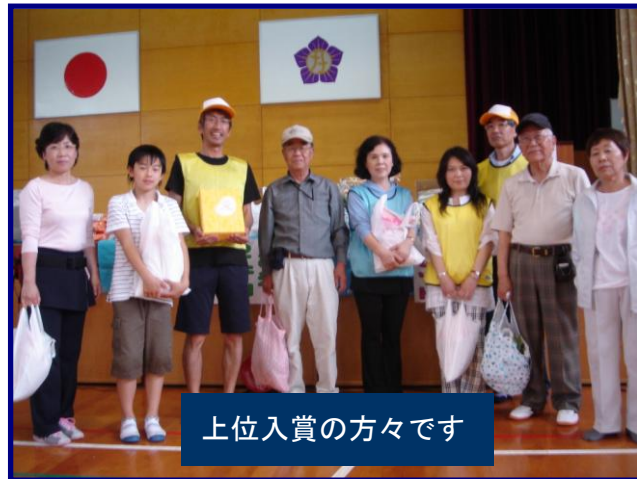
上位入賞の方々です