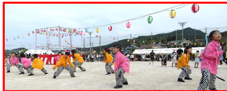
ポーズ決まってるね! ハニーキッズ