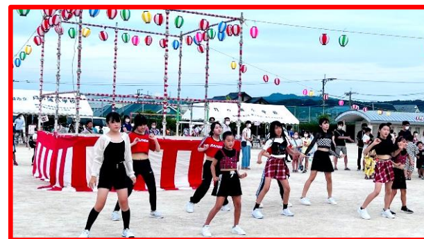
初出演のパールダンス クールでカッコイイ!