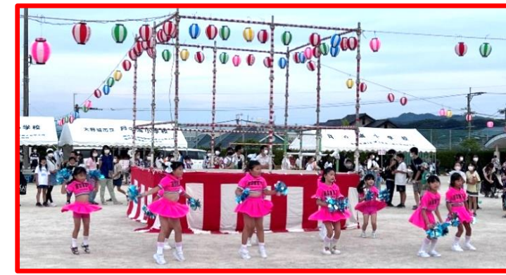
とにかく「カワイイ」キャンディボックス