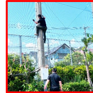
体育部長 提灯の為に電柱に登る