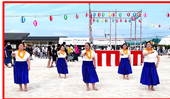
Ohana フラダンス 暑くても優雅です!