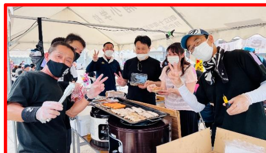
おやじの会出店 大盛況!