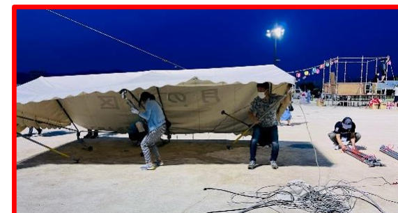
テントは片付けるのもたいへん