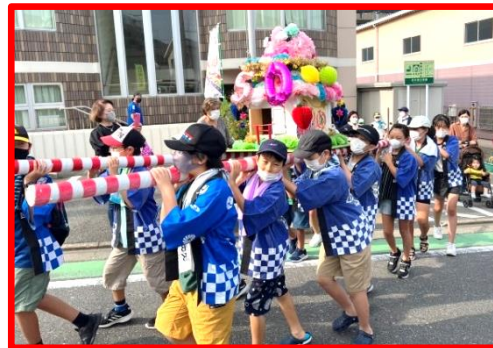
「市制50周年」をテーマにカラフルに飾り付けた子ども神輿が公民館をスタート