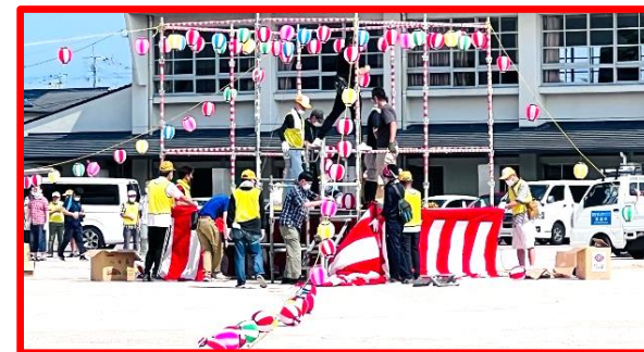
ホントに提灯の飾りつけ最後ですか by 体育委員