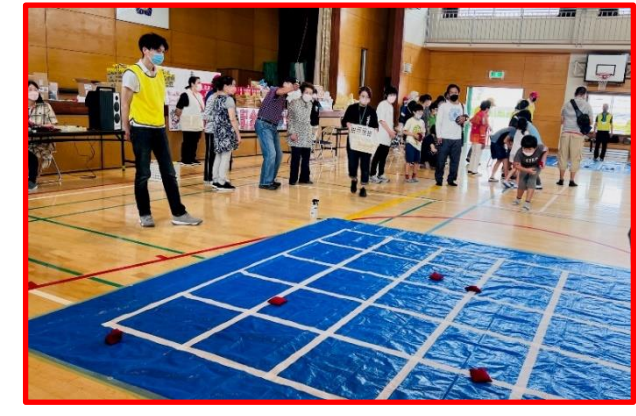
<五目お手玉> 何マス入るかな？ 狙いを定めて～