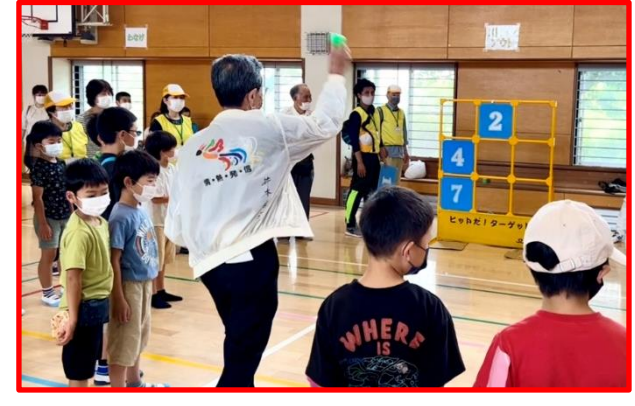
<ストラックアウト> 市長による始球式 みんなで応援