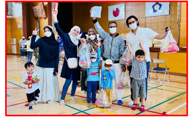
月の浦在住のパレスチナ・マレーシア・インドからの 家族連れ 沢山の賞品をゲットしてガッツポーズ！