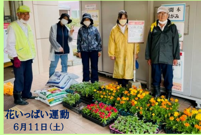
花いっぱい運動 6月11日(土)

梅雨入りが近いこの日、市から届いた色鮮やかなマリーゴールドやサルビア、ガザニアを公民館前や西公園、南公園に植えました。すでに「月の浦ひまわりプロジェクト」のひまわりも元気に咲き始めています。暑い毎日ですが少し足を止めてご覧ください。