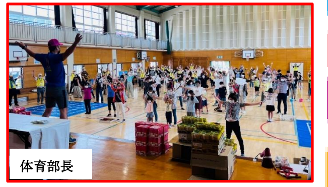
準備運動はみんなで♪ラジオ体操