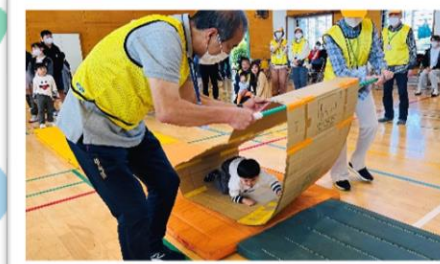
がんばれ!ブルドーザー 進めてるかな