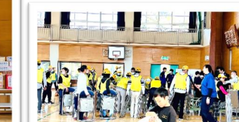
体育委員さん 準備 競技 片づけなど ありがとうございました