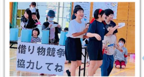
誰か~ キーホルダー持っていないませんか~ 誰か~ 手帳 持っていないませんか~ あちこちで飛び交う声