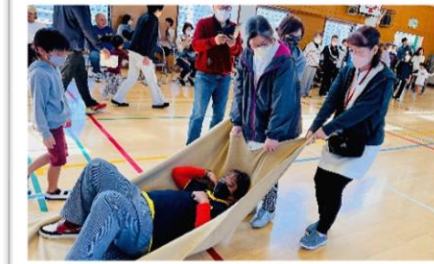
シニア会長を安全に30秒で救出せよ