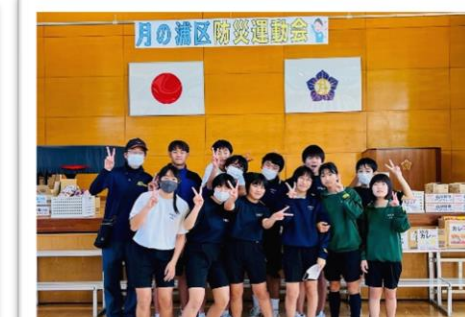
頼りになります! 平野中学校の生徒さん