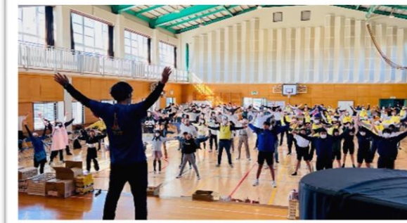
みんなでラジオ体操! さあ頑張るぜ!