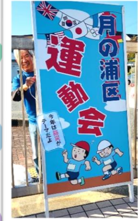
防災運動会 始まるよ~