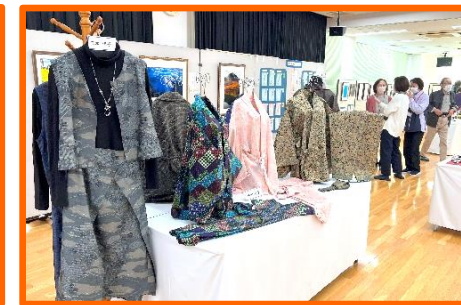
着物からステキにリメイク