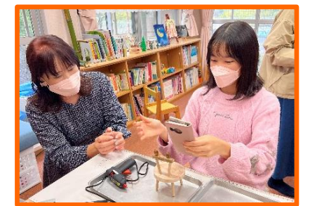
わあ! ミニプランター台の完成!