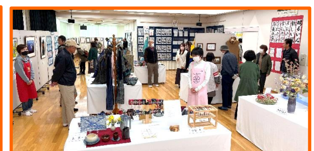
紙面の都合上 すべての作品をご紹介出来ず...