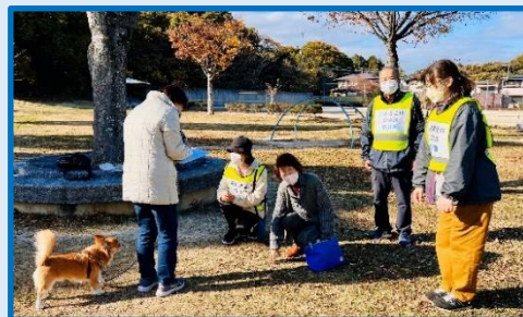
西公園 ワンちゃんも共に避難