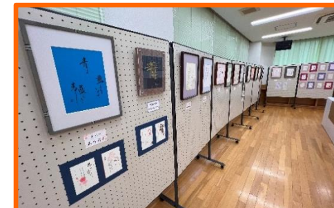
ペン習字 心に響く言葉と 美しい文字に感銘