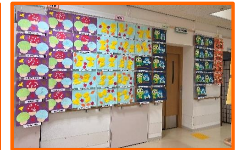
月の浦保育園の皆さんの作品