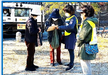
ヒルズ公園 ご近所さんと避難場所へ

逃げタオル運動 一時避難場所(公園)へ避難 公民館での避難所開設訓練として、AED 講習 防災品展示など、予想を上回る参加で防災の意識が高まっていることを実感しました。