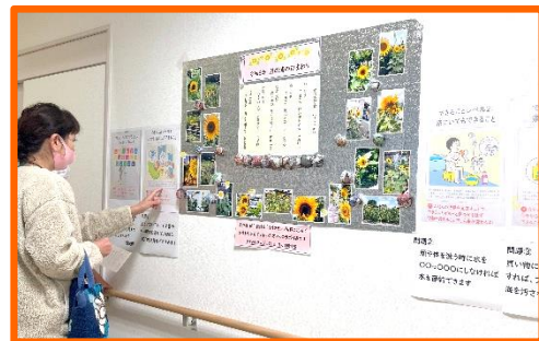
環境部による SDGsクイズ 先着でガーデンシクラメンをどうぞ~