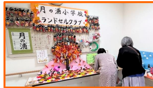
あったあった! うちの子の作品だ

ソフトバンク応援隊の作品 応援しようぜ! ユニフォームから クッションやバッグへと