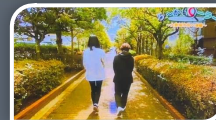
街を縦断する遊歩道 アナウンサーを案内

ケーブルテレビから取材を受けた 公民館スタッフ、緊張しながら 月の浦を紹介しました。 近隣公園のモニュメント、緑に囲まれ た遊歩道、林立するマンションそして 光の道、紹介していく度に改めて素敵 な良い街であることを実感しました。