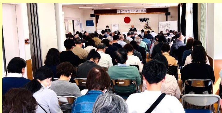
令和5年度月の浦区総会 出席者119名 委任状849世帯 すべての議案に承認を頂きました

皆様にはお変わりなく、ご健勝のことと推察申し上げます。この度、お陰様をもちまして令和5年度の月の浦区総会を無事終了しました。新型コロナウイルスは以前に比較して、格段に減少しつつあり、4年振りに殆ど制限なしの会場にて開催することが出来ました。初めての経験であり、至らぬ点多々ありましたが、次回からはもっとより良い総会にすべく、努力していく所存です。みなさまの最も身近な学習拠点、交流の場としての役割を全うできるよう公民館職員一同、最善を尽くして参ります。可能な限りコロナ以前の日常にもどり、計画通りの諸行事が実施できるよう頑張っていきます。以上簡単ではございますが、年度初めのご挨拶とさせていただきます。今年度も宜しくお願い致します。