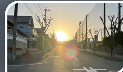
光の道 右側は月の浦小学校南門

ケーブルテレビから取材を受けた 公民館スタッフ、緊張しながら 月の浦を紹介しました。 近隣公園のモニュメント、緑に囲まれ た遊歩道、林立するマンションそして 光の道、紹介していく度に改めて素敵 な良い街であることを実感しました。