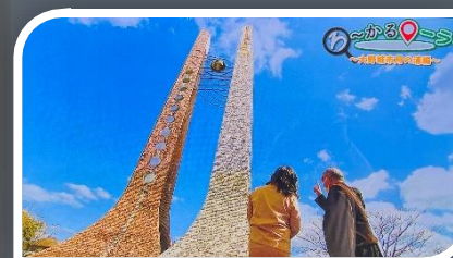
近隣公園にそびえる月の浦のシンボルの モニュメント 月の満ち欠けを表現