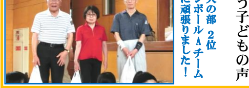
⑥ 大人の部 2位 ラージボールAチーム 元気に頑張りました!