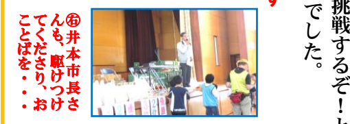
⑤ 井本市市長さんも駆けつけ、おめでとうさーり、おほさーり、おほさーり、おほさーり