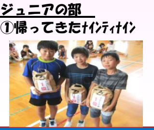
① 帰ってきたインディアン

6月3日「いこいの里」で、平成の会舞踊愛好会の踊りを発表させていただきました。今回も日向ひよつとこ踊り月の浦愛好会・カラオケ愛好会の皆さまの賛助出演により、日曜日の午後のお風呂上がりのひと時を、お楽しみいただけたでしょうか・・・と思います。その中でも一番人気は、幼児・小学校低学年の子ども達のひよつとこ踊り可愛いわい可愛い!!の大きな拍手に会場の皆さまと一緒に、笑顔あふれる踊りの大きな輪となりました。ありがとうございます