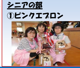
① シニアの方も元気に「マイ」と気合をいれて投げています