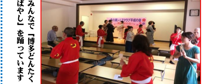
② みんなで「博多どんたくばやし」を踊っています