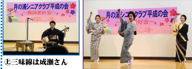
① 乙女3人で「おこさ節」を踊っています