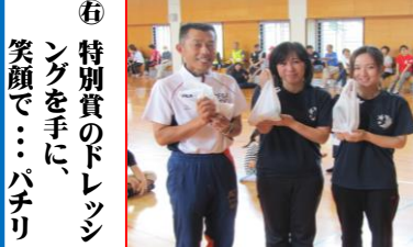
② 特別賞のドレッシングを手に入れたパチリ笑顔で…