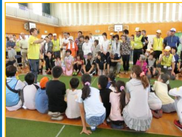
① 体育部長より、実施内容・競技のこまかい説明を、レーンの周りで行っています。