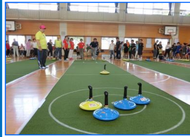
① 決め手の一投～勝負は、どちらに…