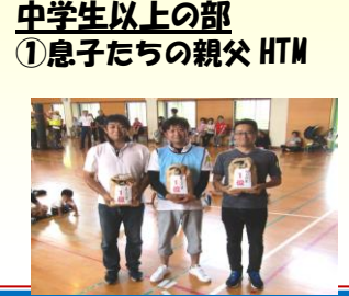
① 息子たちの親父 HTM