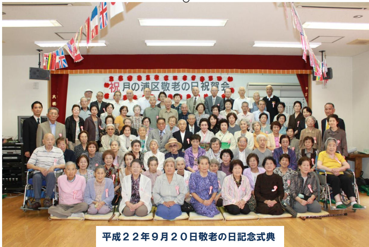
平成22年9月20日敬老の日記念式典