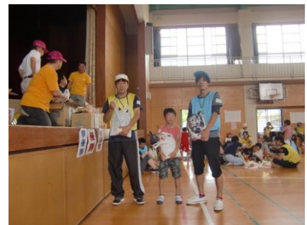
お米をゲットした 昨年の優勝チームです！