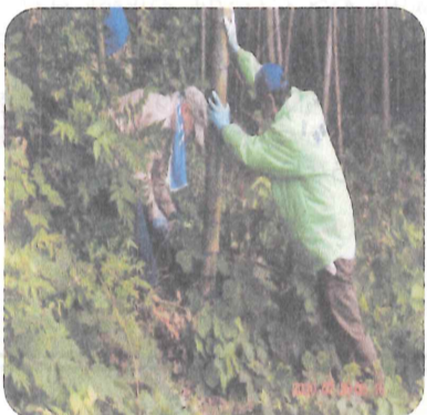
しっかり支えてね