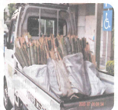
切り揃えた竹の袋詰め 南コミへ搬送