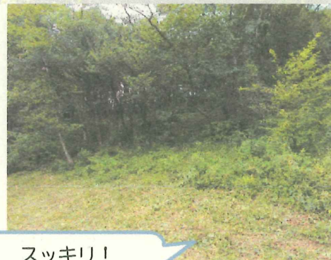
スッキリ！ 明るくなりました