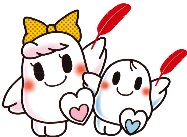
赤い羽根共同募金運動のシンボルキャラクター 愛ちゃん（左）と希望くん（右） （昭和61年生まれ）