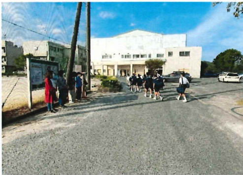
PTAあいさつ運動の様子

9月23日(水)～9月25日(金)において、PTAのあいさつ運動がありました。今年度初めてのあいさつ運動にPTA本部をはじめ、3学年委員、3学年広報委員、月の浦地区委員の皆様にご協力を頂きました。2学期の中間考査は、例年と違い9教科あるので試験勉強疲れの生徒も見られました。11月も予定していますので、多くの保護者の方に参加していただければ幸いです。