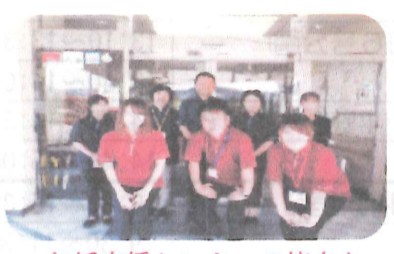
包括支援センターの皆さん

南地区地域包括支援センターは大野城市の委託を受けて、65歳以上の相談窓口として、主任介護支援専門員、介護支援専門員、保健師、社会福祉士、認知症地域支援推進員の8名のスタッフで、包括的・継続的ケアマネジメント支援業務・介護予防ケアマネジメント業務・権利擁護業務・総合相談支援業務を行っています。 地域の高齢者の方が住み慣れた地域で安心してその人らしい生活を継続していくことが出来るようにするため、どのような支援が必要か把握し、地域における適切なサービス、関係機関及び制度の利用につなげる等の支援を行っています。 ★ 家族介護者教室のお知らせ 自宅で要介護ならびにその可能性が高い高齢者の家族等を対象に適切な介護知識、技術の取得を目的としており年に2回開催しています。 ★ 65歳以上の皆様のお宅を訪問しています。 独居の方、高齢者世帯の方の自宅を訪問し生活の状況の確認や、何かあった時の連絡先などを聞かせて頂いております。ご協力をお願いいたします。