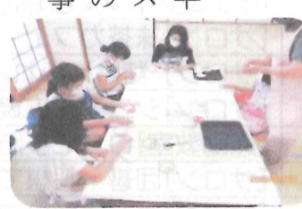
子どもたちの居場所作り

つつじヶ丘公民館では、平成16年10月よりアンビシャス広場を開所し、子どもたちの居場所づくりとして様々な事業を展開してきました。