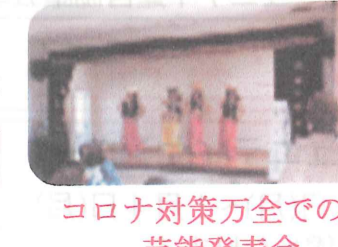
コロナ対策万全での芸能発表会

南ヶ丘2区では、10月18日(日)2区公民館集会所において「2区芸能発表会」を開催しました。今年はコロナ禍の影響で地域サークル活動をされている方々も、日頃の成果を発表する機会がないとの声をたくさん聴いておりましたので、何か皆さんの要望を叶える方法はないかと考えておりました。