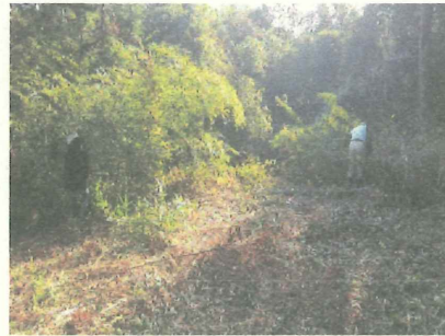
サポーターさん達の努力で・・・