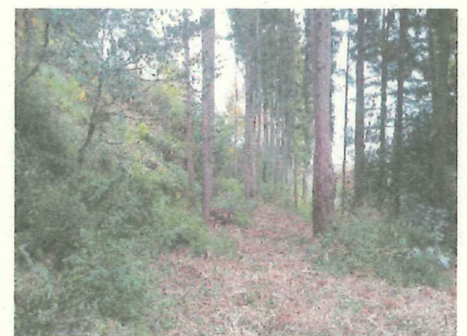
山の傾斜が分かるようになりました！