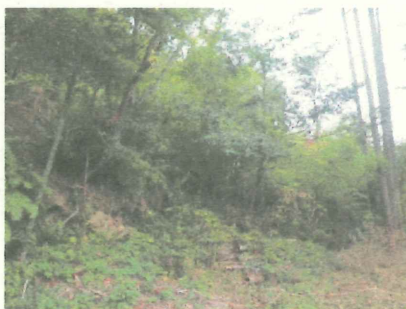
こんな斜面も・・・