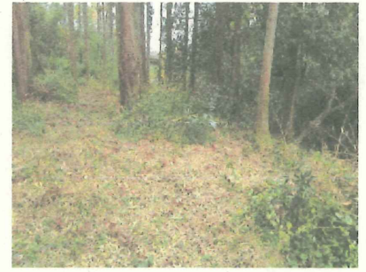
スッキリしました！