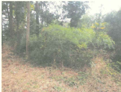
こんなぼさぼさの藪も・・・

古代の焼き物「須恵器」を作っていた窯跡です。当時の操業規模はなんと九州最大！国指定史跡にも指定されています。